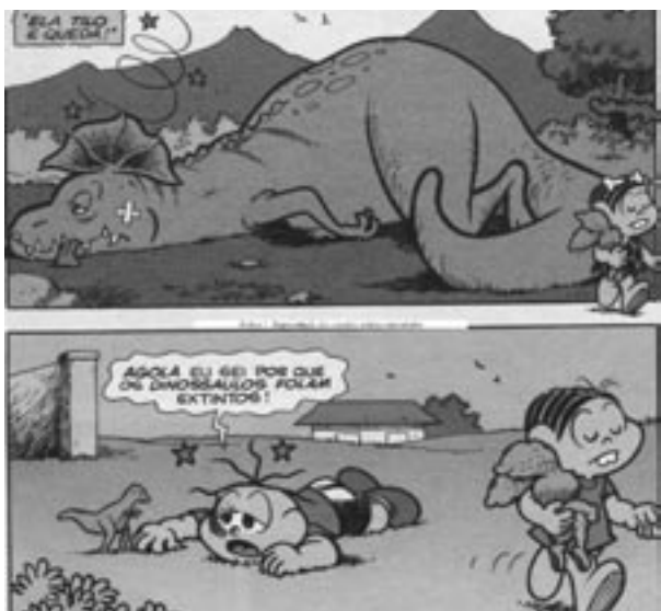
Figura 3 «Dinosaurios», de Cebolinha, 159.