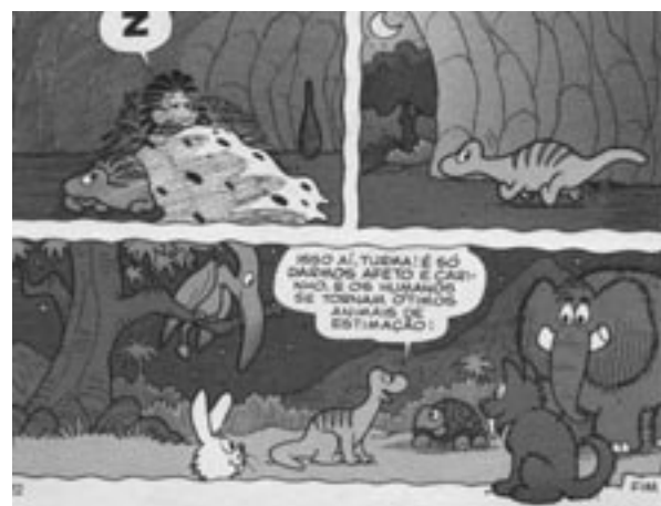
Figura 14 «Bicho de Estimação», de Cebolinha, 134.

Los errores en las figuras son de tres tipos: a ) figuras con características mezcladas, como el del personaje Alfredo (historias de Horácio), un pterosaurio que presenta características de dos grupos diferentes, Rhamphorhyncoidea (cola) y Pterodactyloidea (cresta), y varios dinosaurios en las historias de Pitéco (Figs. 5, 2 y 14); b ) personajes de tiempos geológicos diferentes coexistiendo, como dinosaurios con humanos, o el mamut Antão presente en las historias de Horácio; c ) varios animales y vegetales recientes apareciendo en las historias de Horácio (lechuga) y Pitéco (búho, conejos y palomas) (Figs. 2, 4, 13 y 14); d ) un último tipo de error es el estilo de las figuras donde los personajes guardan poca semejanza con la figura original. En este último tipo, la mayoría de las veces, los animales son combinaciones de características de varios animales (Figs. 5, 8 y 9). Esto se ejemplifica en la figura 15 donde el dinosaurio más grande presenta características morfológicas de un dinosaurio Ceratopsida (grupo de dinosaurio con pelvis de ave y con cuernos que vivieron en el cretácico superior) en la cabeza de un oso (mamífero) y el cuerpo de un dinosaurio Stegosauria (grupo de dinosaurio con pelvis de ave con una armadura de formación ósea en la parte dorsal que vivieron del jurásico al cretácico inferior).