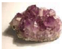
Figura 12. Les roques inspiren els poetes.

el responsori de les boires tristes que sots avall s'agemoleixen com un enderroc de noves ametistes.