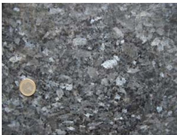
Figura 5. Fotografia de la roca ornamental inclosa en la fitxa.

S'han estudiat les roques ornamentals utilitzades en el Passeig de la Salut, el Carrer del Mar i el Carrer Canonge Barranera i les roques de construcció de l'Església de Santa Maria, el Monestir de Sant Jeroni de la Murtra i les Termes Romanes de Badalona (fig.6).