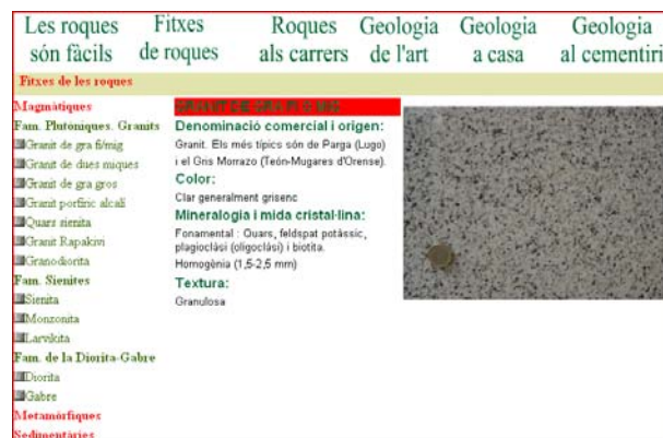
Figura 2. Exemple de fitxa d'una roca

La seva estructura es basa fonamentalment en un conjunt en fitxes de roques (fig.2) que són d'ús pràcticament universal.