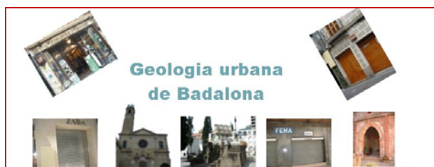
Figura 1. Àmbits del recorregut urbà

El dia a dia de l'activitat escolar demostra que hi ha raons molt diverses que limiten les possibilitats reals de plantejar excursions de geologia tant amb nois i noies de primària o secundària com en formació d'adults. El lloguer d'autocars, la despesa econòmica generada per la pròpia excursió, la necessitat de disposar d'un dia sencer per a la sortida, encabir aquesta data en un calendari lectiu generalment força carregat, etc., representen una suma de dificultats no sempre senzilla de solucionar.