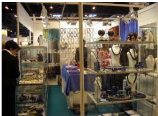
Figura 11 . No només a les façanes hi ha roques.