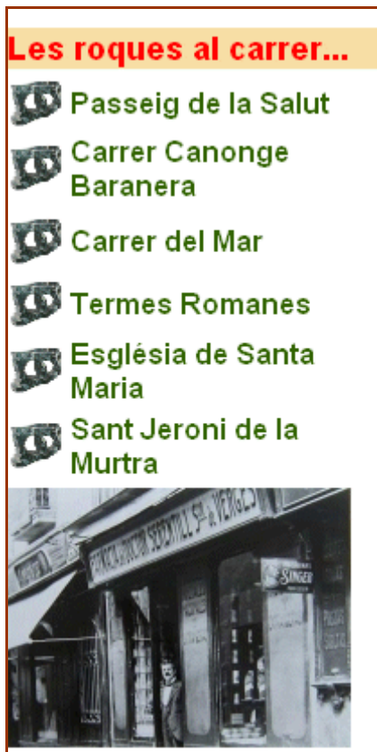
Figura 6. Carrers i monuments de l'itinerari.