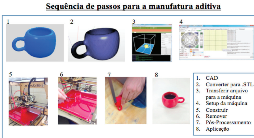
Figura 2 - Etapas para produção de peça por manufatura aditiva.