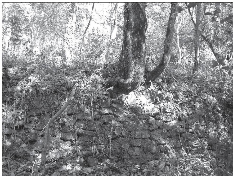
Figura 1 AVANCE DE LA VEGETACIÓN SOBRE LOS ANTIGUOS BANCALES AGRÍCOLAS

Se han documentado usos del suelo agrícolas relacionados con actividades de obtención de cereales (trigo y cebada), patatas y productos hortícolas. El abandono de estas actividades en Ridaura tuvo lugar aproximadamente en el primer tercio de la década de los '70. Actualmente son visibles numerosos bancales abandonados con estructuras vestigiales de pared seca que, aún existiendo cierta heterogeneidad morfológica en conjunto, tienen como característica general la presencia de vegetación que los ha invadido e incluso se ha desarro-