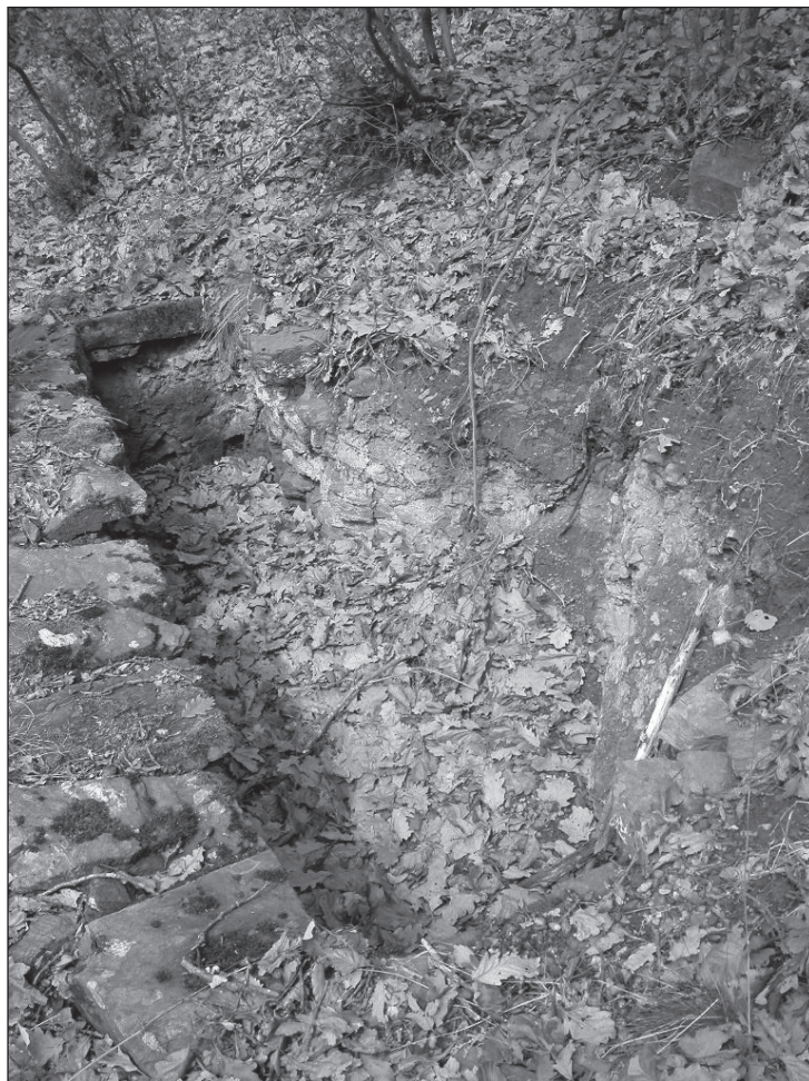
Figura 2 HORNOS DE CISCO RELICTOS