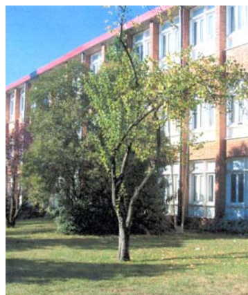
Figura 1. Fotografia d'una zona dels jardins de l'Institut.

També pensem que les Ciències Naturals han d'estar integrades amb la resta de matèries que s'imparteixen a l'ESO i és la nostra preocupació que desenvolupin destreses relacionades amb: l'educació visual i plàstica, fomentant els dibuixos científics a partir de material biològic (closques de mol·luscs, fulles d'arbres, escamarlans o peixos quan fem les pràctiques de dissecció); les llengües, quan els fem explicar, oralment i per escrit determinats processos o observacions fets per ells; i les ciències socials, si els fem interpretar un plànol o situar-se en ell.