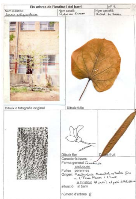
Figura 6. Fitxa, elaborada per una alumna, corresponent a l'arbre de l'amor, Cercis siliquastrum .