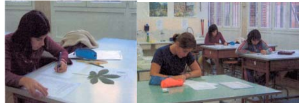
Figura 2. Sessions de treball al laboratori.