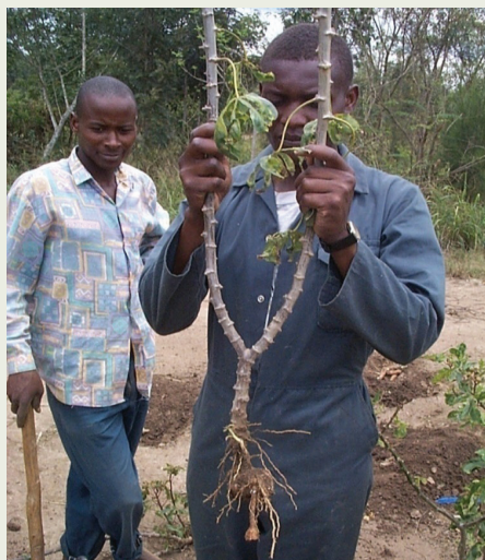
Muhogo ulioshambuliwa na batobato