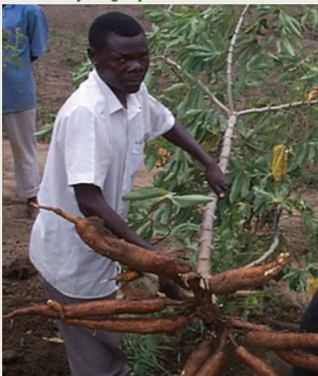
Muhogo usioshambuliwa na Batobato