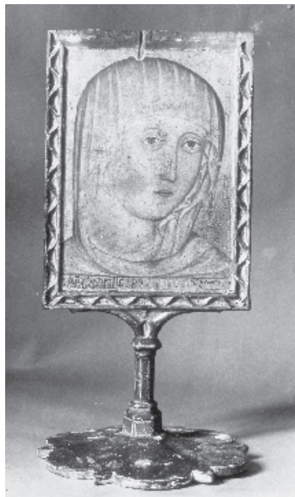
Figura 2. Verònica. Catedral de Tortosa.

Les dades documentals que esmenten la verònica del rei Martí entre 1397 i 1437, quan és donada a la catedral de València, i fins i tot després, destaquen precisament pel fet de mostrar que era una de les relíquies més estimades pel monarca i els seus successors. Si aquesta és una valoració basada en el caràcter pietós i alhora simbòlic de la peça—cal recordar que era un retrat «real» de Maria—, encara hauríem d'afegir a aquest fet la importància que a nivell artístic tingué la verònica del rei Martí en tant que punt de partida d'una tipologia d'indubtable èxit, els reliquiariis pediculats amb santes façs, i altrament per la difusió d'una iconografia a la qual donà lloc, la santa faç de la Mare de Déu, seguida primer per un grup de veròniques marianes