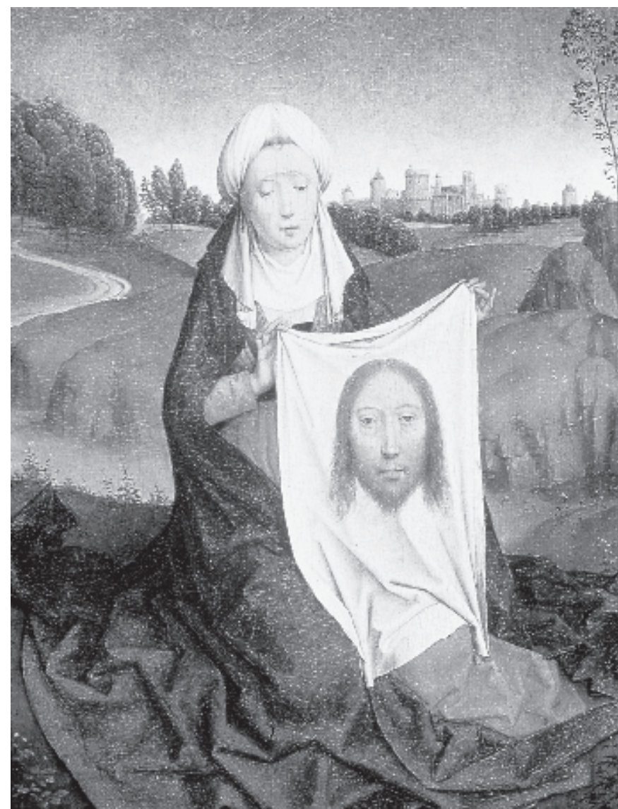
Figura 6. Dèptic. Verònica amb la santa faç de Crist. Hans Memling, ca. 1470-75. Washington, National Gallery of Art.