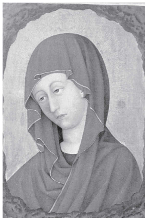
Figura 8. Llibre d'hores de René d'Anjou Bartholomé Van Eyck.

ser significatiu que el quadre commemoratiu de l'esdeveniment es conservés a la Sainte Chapelle, l'oratori personal del rei 61 ; atesa la cronologia de la visita del futur monarca a Avinyó, el dèptic dataria del 1342 i per tant seria anterior a les primeres veròniques catalanes.