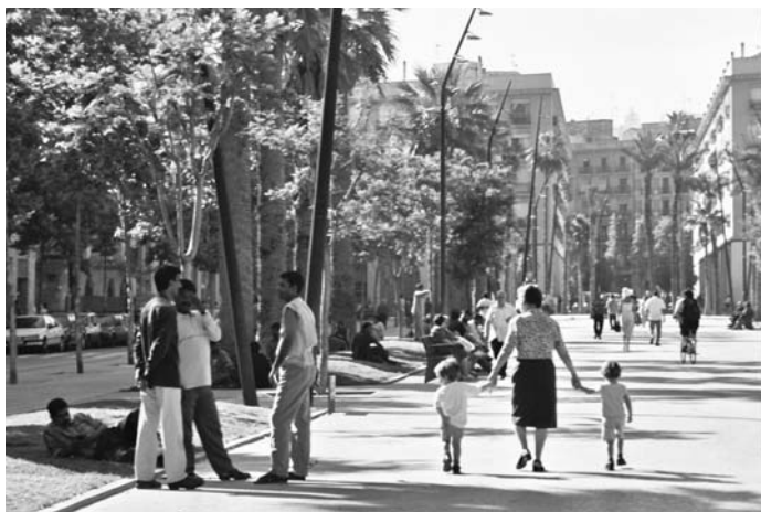
Fotografia 2. Vista general de la rambla del Raval, juny del 2002.

La rambla del Raval ha estat, des de la seva concepció fins a la seva urbanització, una de les operacions urbanístiques més ambicioses i polèmiques de les realitzades per l'Ajuntament al centre històric de la ciutat: ambiciosa per la profunda renovació del teixit urbà, per la construcció d'habitatges de promoció pública i el reallojament en el mateix barri dels veïns i les veïnes afectats per