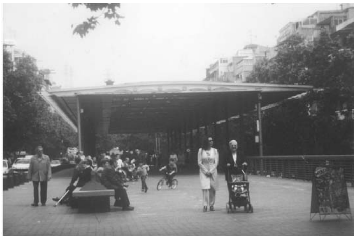
Fotografia 1. Vista general de la Via Júlia, octubre del 2000.

sobre un terreny prèviament no urbanitzat, amb l'objectiu principal de donar continuïtat als barris de Prosperitat i del Verdum, separats per un desnivell de fins a tres metres en algunes cotes. La seva urbanització va assolir un seguit d'objectius: impulsar la regeneració urbanística de Prosperitat i el Verdum, ajudar a crear una identitat de barri i «monumentalitzar» la perifèria a través del disseny urbà de qualitat. Les obres d'urbanització de la Via Júlia van permetre, doncs, «convertir allò que era quasi infranquejable en un eix cívic i de relació ciutadana» (Ajuntament de Barcelona, 1987, p. 62). La Via Júlia va ser una de les primeres extrapolacions de la idea de rambla fetes en barris de la perifèria, la qual cosa va produir un efecte de millora urbana indubtable i va reactivar econòmicament i socialment la seva àrea d'influència (Barnada i Laviña, 1999).