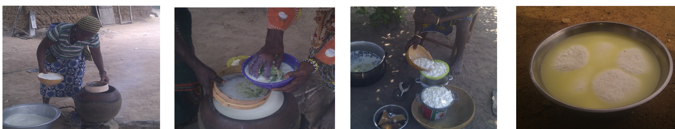
Quelques opérations dans la transformation du lait en fromage peulhs

L'activité est traditionnelle. Elle est exécutée par des femmes Peulh âgée de 39 ans en moyenne, et mariée en régime polygame (2 épouses en moyenne). Les ménages sont à 99% des ménages agro-pastoraux.