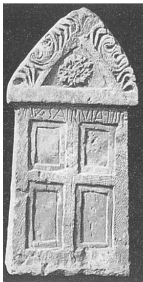
Figura 3. Urbino.