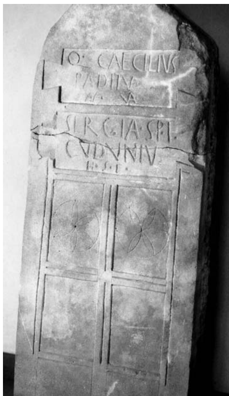
Figura 2. Artà (Sa Carrotja).