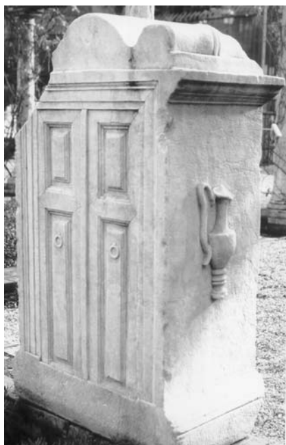
Figura 4. Roma.