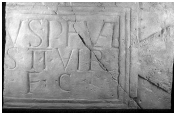
Figura 1. Palma.