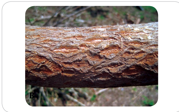
Figura 1. Síntomas del CS en las raíces de mandioca. La raíz presenta depresiones con bordes en forma de labios que se unen semejando una red o panal.

En las plantas enfermas, la raíz se torna leñosa y su cáscara se vuelve gruesa, corchosa y quebradiza, toma un color opaco y no desprende fácilmente. (Figura 1).