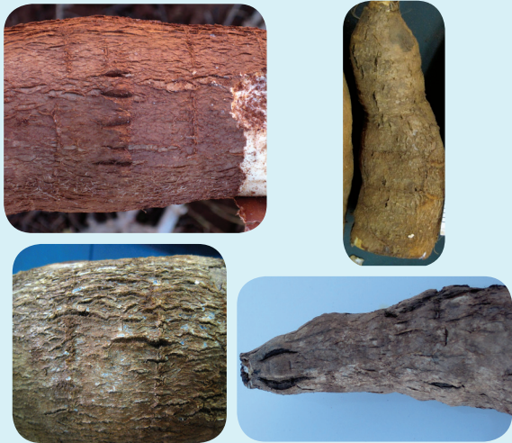
Figura 3. Niveles de severidad de la enfermedad de CS en Paraguay.