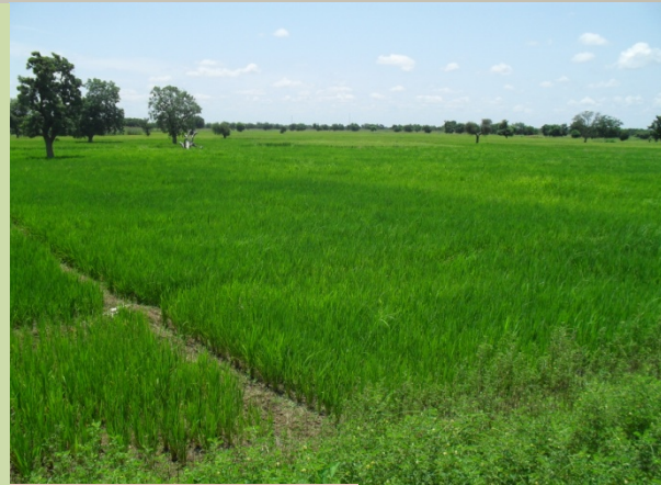
Fig.1: Plaine rizicole

Le CLE peut constituer une plateforme adéquate pour la GIRE au Burkina Faso seulement si les acteurs locaux peuvent jouir de certaines responsabilités (pouvoir) et avoir des attributions bien définies.