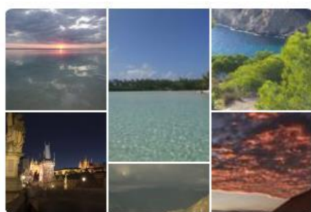
Ciencia, literatura y Vi... 47 pines

Todas las fotografías presentadas al concurso—un total de 53— pueden verse en dos paneles en Pinterest creados por la biblioteca para esta actividad. Uno de los paneles recoge las fotografías de la categoría de adultos y el otro las imágenes presentadas a la categoría infantil . Además, durante la Semana de la Ciencia de Madrid 2017, todas estas fotografías estuvieron expuestas en las instalaciones de la biblioteca, como se muestra en las imágenes incluidas más abajo.