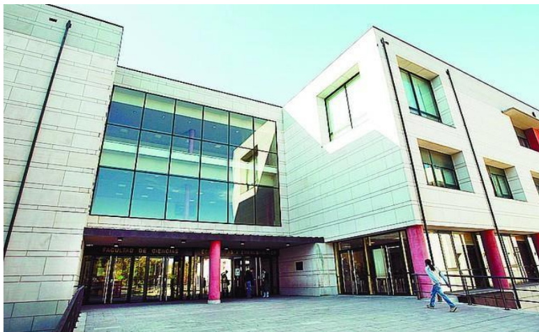
Figura 2: Facultad de Ciencias Económicas y Empresariales.

En el pasado la Escuela Universitaria de Estudios Empresariales se situó, sin embargo, en el campus de Río Vena / Vigón.