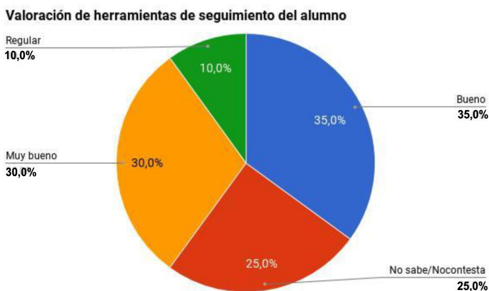
Figura 1: valoración de las herramientas de seguimiento de alumnas/os.

Al momento de preguntar sobre la valoración de las herramientas de seguimiento de alumnas/os (Figura 1), la opinión fue positiva también: el 65% las consideraba entre muy buenas y buenas, solo el 10% las creía regulares. Un 25% no contestó, es posible que esto se deba a que no existe una articulación entre el campus y el sistema de gestión implementado, el ya mencionado SIU Guaraní. Así, se da un doble trabajo al tener que transcribir información al otro sistema para elevarla al Departamento de Enseñanza de la FAHCE.