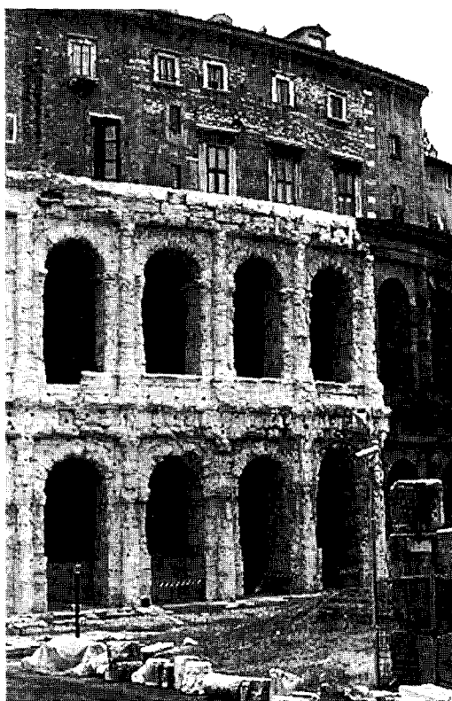
Figura 2 Roma, Teatro de Marcelo, detalle de la fachada

jónico estaban tabicados con paredes de sillares de toba asentados con mortero. 7