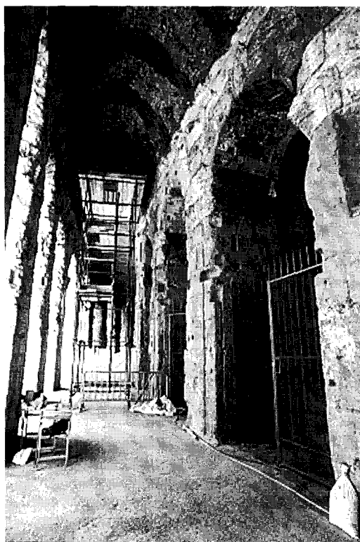
Figura 3 Roma, Teatro de Marcelo, ambulacro orden dórico

El orden dórico de la planta baja estaba cubierto por una bóveda anular de hormigón, de sección circular. Dos tramos originales de la misma se hallan todavía en las doce arcadas que quedan: el primer ojo por la izquierda y, tal y como se ha observado recientemente, los últimos tres de la derecha. El resto se reconstruyó durante las obras de restauración de los años treinta (figura 3).