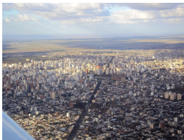
Fig. 2 Imagen aérea de La Plata.

En las últimas décadas, La Plata sufrió grandes cambios en su paisaje urbano histórico, bien como un claro degrado de su patrimonio cultural material. Todo lo que fue expuesto provoca algunos cuestionamientos que superan a la escala de la ciudad y sirven para amplias reflexiones sobre el tema: ¿Es necesario que una ciudad se “cristalice” en el tiempo para ser comprendida como un bien patrimonial? Aún, ¿Es posible que una ciudad se “cristalice” en el tiempo? ¿Esta no puede cambiar y ser patrimonio a la vez?