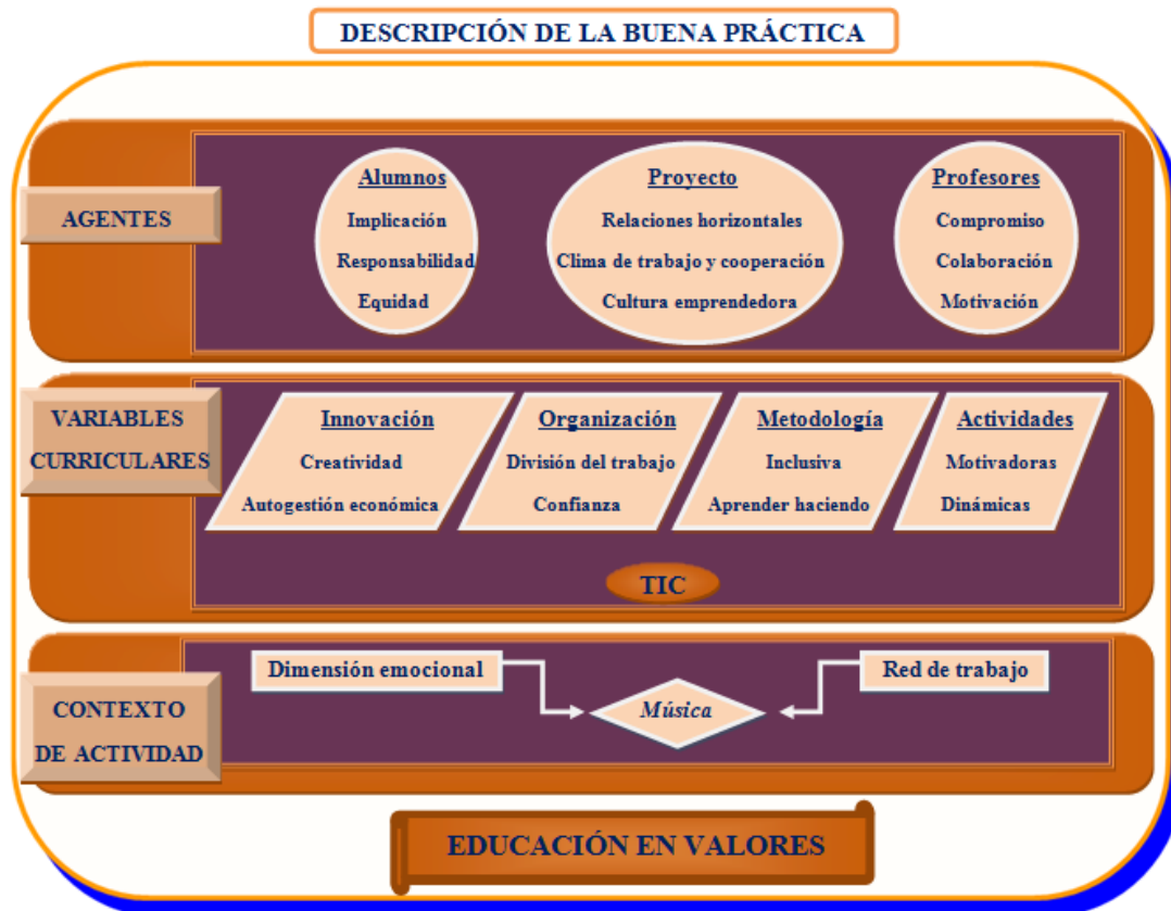
Mapa 1: Descripción de la buena práctica

La descripción de la buena práctica se ha estructurado en base a tres aspectos fundamentales: los agentes, las variables curriculares y el contexto en el que se desarrolla la actividad. Todos esos ámbitos estarían dentro del marco de la educación en valores, la cual es identificada como la finalidad principal del proyecto coral (“...en este proyecto se trabaja con la persona” 1:28). Cada año, la temática de los ensayos y las posteriores actuaciones del coro giran en torno a un valor o valores, que se transmiten a través de la música.