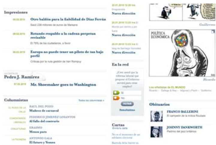
Figura 3.- Detalle de la sección de Opinión y Blogs de www.elmundo.es

En el lado izquierdo, una foto de considerable tamaño, en este caso del presidente del Gobierno, acompañando al editorial del día. Más centrado, se encuentra en una columna el apartado de Tribuna Libre con el título del artículo, vinculado en forma de enlace al texto y con un resumen de 38 palabras sobre el mismo. A la derecha, se puede observar un videoblog, con una duración de un par de minutos, en la que el director del diario, Pedro J. Ramírez, realiza un análisis de la situación política, económica y social del país concerniente a la actualidad más reciente.