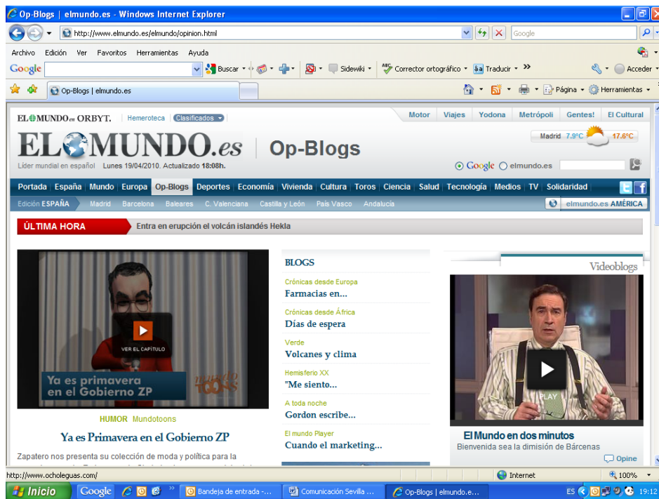
Figura 2.- Pantalla con la imagen de la sección de Opinión y Blogs de www.elmundo.es

En el lado izquierdo, una foto de considerable tamaño, en este caso del presidente del Gobierno, acompañando al editorial del día. Más centrado, se encuentra en una columna el apartado de Tribuna Libre con el título del artículo, vinculado en forma de enlace al texto y con un resumen de 38 palabras sobre el mismo. A la derecha, se puede observar un videoblog, con una duración de un par de minutos, en la que el director del diario, Pedro J. Ramírez, realiza un análisis de la situación política, económica y social del país concerniente a la actualidad más reciente.