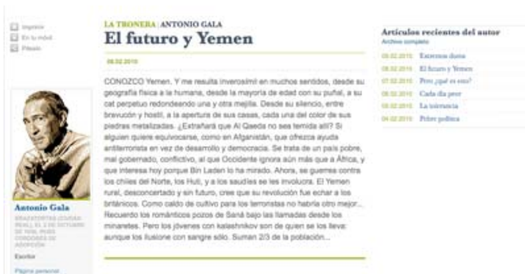
Figura 4.- Detalle de la sección de Antonio Gala ‘La Tronera’ en la sección de opinión de www.elmundo.es

Las consideraciones, apuntadas por Salaverría, en el año 2005, siguen vigentes después de cinco años. El motivo es más que evidente, exceptuando los blogs, la foto del presidente del Gobierno, el videoblog de dos minutos y la encuesta virtual, el resto de los contenidos son reproducciones literales de la edición impresa. En otras palabras, la redacción web se transforma paulatinamente, otra particularidad es la posibilidad de opinar respecto al asunto abordado en los editoriales del día, una opción que provoca el debate virtual entre los lectores. Aún así, en el resto de los textos opinativos, se reproduce el mismo modelo que en prensa escrita. Veamos como ejemplo, el suelto de Antonio Gala que lleva como nombre “La Tronera”.