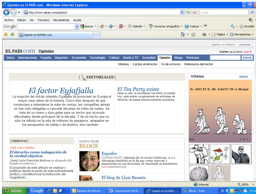
Figura 5.- Imagen del pantallazo a la sección de opinión del diario El País en su versión online.

En la medida en la que el usuario desplaza la mirada por la parte inferior de la interfaz da la impresión de un exceso de información ante todas los enlaces que le son remitidos a diferentes subsecciones: tribunas, columnistas, defensor del lector, cartas, diarios online o frases escritas por los propios lectores. Una peculiaridad que suma como reclamo de participación ciudadana en la web, además de la encuesta virtual del día, con opciones a seguir votando en otras encuestas anteriores, la de añadir foros de debate de carácter temáticos, tanto de política nacional como de política internacional.