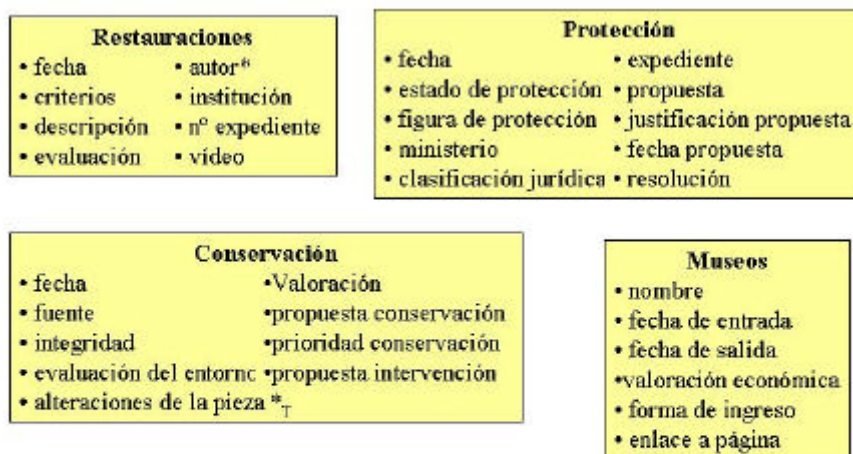
Figura 3: Datos no básicos de bienes muebles

En definitiva, el objetivo es presentar la gran cantidad de información que se almacena y la complejidad que esto presenta no sólo por la cantidad, sino también por la diversidad de medios.