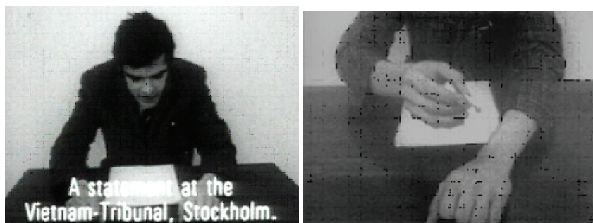
Un fuego que no se apaga, 1969

600 grados Celsius, mientras que el napalm lo hace aproximadamente a 3.000 grados”.