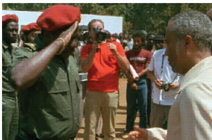
Sin sol, 1982

La voz-en-off se lanza entonces a una disquisición sobre la naturaleza de la historia como fuerza que reprime la memoria individual y la subordina a una narrativa totalitaria. "En lugar de lo que se nos presentaba como memoria colectiva, miles de recuerdos personales que pasean su laceración individual en la gran herida de la historia (...)" El ejercicio está efectivamente diseñado para exponer la fragilidad y la tiranía de la historia, pero representa un perfecto ejemplo de dialogización de la imagen, en cuanto al confrontar una imagen aparentemente autosuficiente (de nuevo un desfile militar que celebra en este caso la consecución de la independencia) con una imagen futura que no se muestra (el conflicto entre los dos hombres que en la imagen se abrazan) nos permite cuestionar la primera y vincular claramente su interpretación a un contexto mutable, cambiante, plenamente alejado de cualquier patrón simplista de conocimiento.