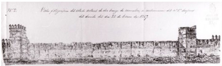
Figura 3. “Nº 3. Vista fotográfica del estado actual del lienzo de muralla más próximo a la Puerta de Córdoba después del derribo verificado el día 28 de marzo de 1867, a continuación de los numº 1 y 2”. Anónimo. Archivo de la Real Academia de Bellas Artes de San Fernando.