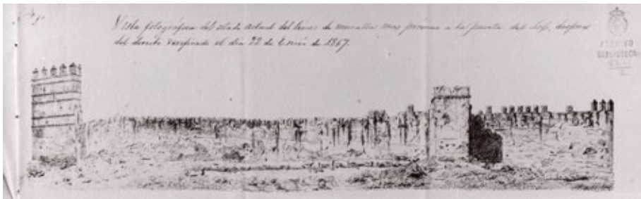
Figura 2. “Nº 2. Vista fotográfica del estado actual de otro lienzo de murallas, a continuación del nº 1 después del derribo del día 22 de Enero de 1867”. Anónimo. Archivo de la Real Academia de Bellas Artes de San Fernando.