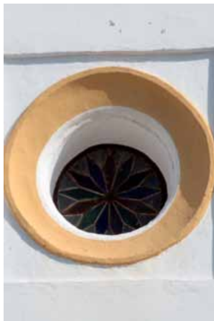
Figura 5. Vidriera situada sobre la portada de los pies. Anónimo. 1741. Iglesia Parroquial de Nuestra Señora de la Granada, Guillena.