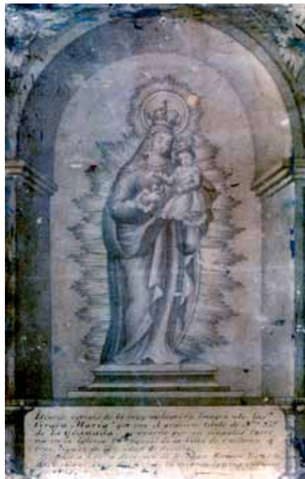
Figura 1. Grabado de Nuestra Señora de la Granada. Anónimo. 1854. Propiedad particular.