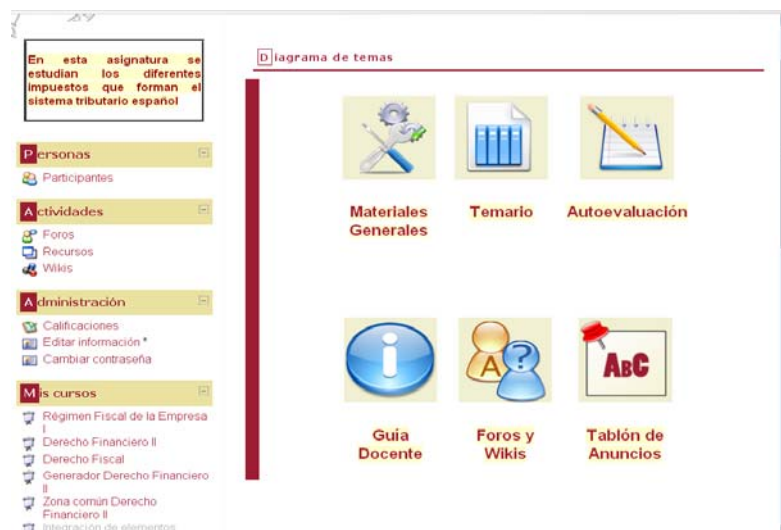
Figura 2. Asignatura Derecho Financiero II

Los tres iconos de la línea de arriba (ver figura 2) dan acceso al material compartido depositado en el curso generador de contenidos. Además, se han incluido iconos propios de la asignatura que permiten navegar a través de los materiales y actividades docentes específicas de la asignatura Derecho Financiero II (guía docente de la asignatura, tablón de anuncios y otras utilidades de diverso tipo).