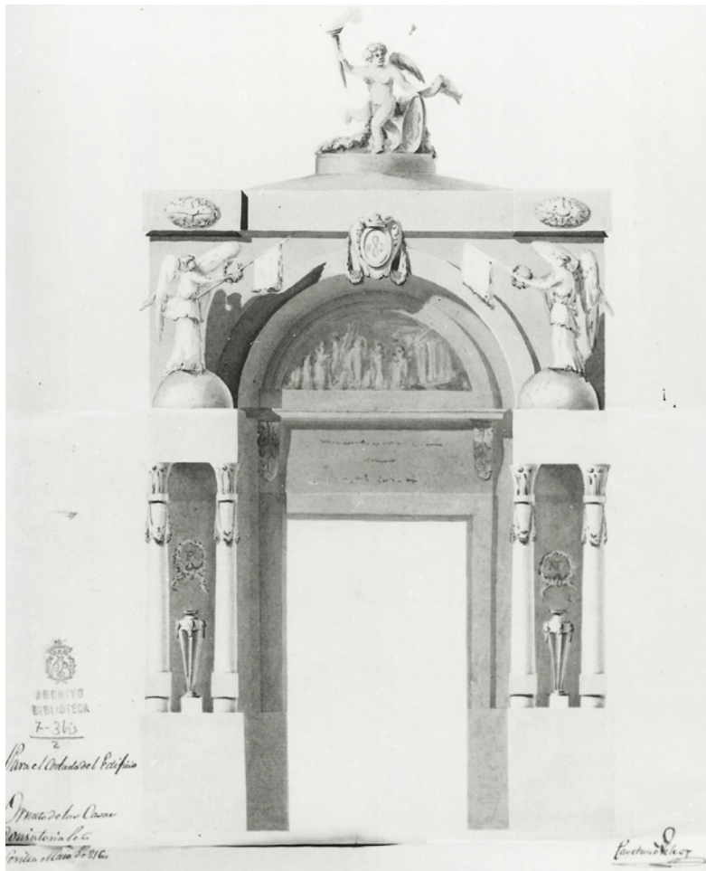
Figura 1. Cayetano Vález. Ornato para el costado de las Casas Consistoriales. Sevilla, mayo de 1816. Tinta y aguada. Archivo de la Real Academia de San Fernando de Madrid.

Fecha de aceptación: 20 de noviembre de 2015.