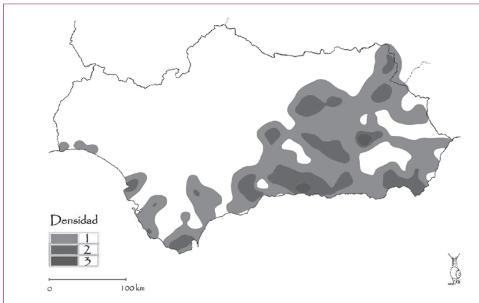
Figura 3. Representación topográfica de las "formas singulares" de caracoles comestibles halladas en Andalucía, en cuanto a la densidad del número de formas taxonómicas (la intensidad de color indica el número de formas en cada área).

Representando topográficamente sobre el mapa de Andalucía el número de formas taxonómicas totales hallamos que los caracoles comestibles se encuentran ampliamente distribuidos en la región aunque con significativas diferencias en cuanto a su densidad, siendo esta mayor en el sector oriental coincidiendo con el desarrollo de los grandes Macizos Béticos (las áreas en blanco coinciden por lo general con substratos de carácter ácido o con las altas cumbres de las sierras; ambas circunstancias impiden el desarrollo de poblaciones de caracoles). De igual modo si atendemos a la distribución de las formas comunes frente a las singulares observamos que las dos áreas representadas (Fig. 2 y 3) son prácticamente disjuntas, destacando que el área de distribución de las formas taxonómicas singulares (Fig. 3) coincide igualmente con el sector bético (sector sur oriental de Andalucía).