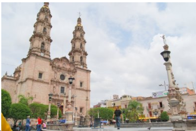
Fig. 3 Imagen de la Catedral de Nuestra Señora de San Juan de los