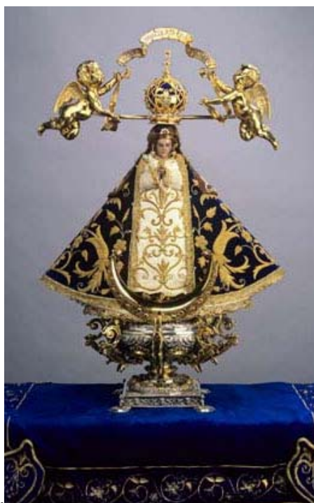
Fig. 2. Imagen de Nuestra Señora de San Juan de los Lagos,