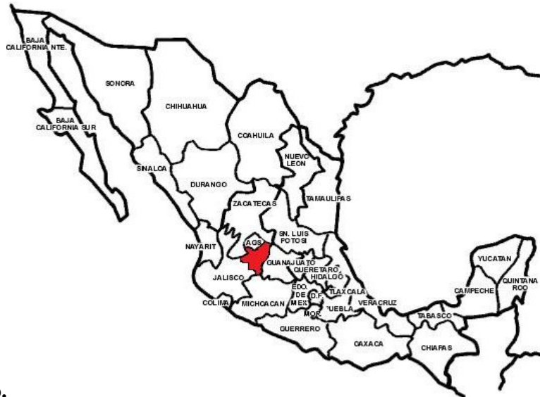
Fig.1 Ubicación del Santuario de San Juan de los Lagos, en la Región de los Altos de Jalisco en el mapa de