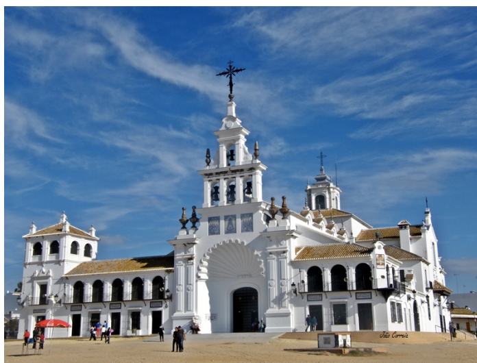
Fig. 6. Imagen de la Catedral de Nuestra Señora del