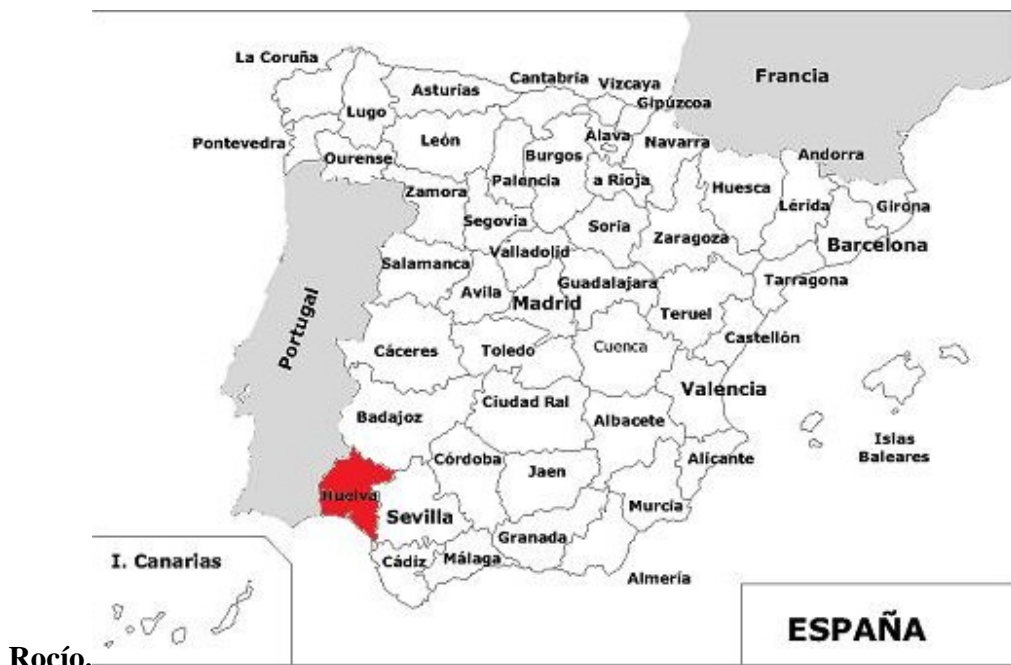
Fig. 4. Ubicación de la Provincia de Huelva en el Mapa de España, donde se encuentra el Santuario de Nuestra Sra. Del Rocío.