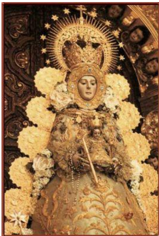
Fig. 4. Imagen de Nuestra Señora del Rocío