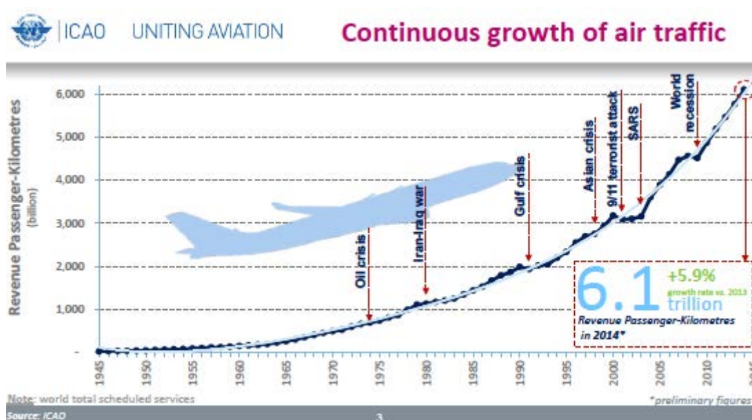
Imagen 1. Crecimiento continuo del tráfico aéreo

Para que este crecimiento continúe, hay que tener en cuenta muchos factores y hay que saber atender las necesidades de todos los segmentos de clientes. A este respecto, como ya hemos comentado, los turistas con discapacidad ofrecen una gran oportunidad de mercado, debido a que las cifras mundiales de personas con discapacidad también están aumentando.