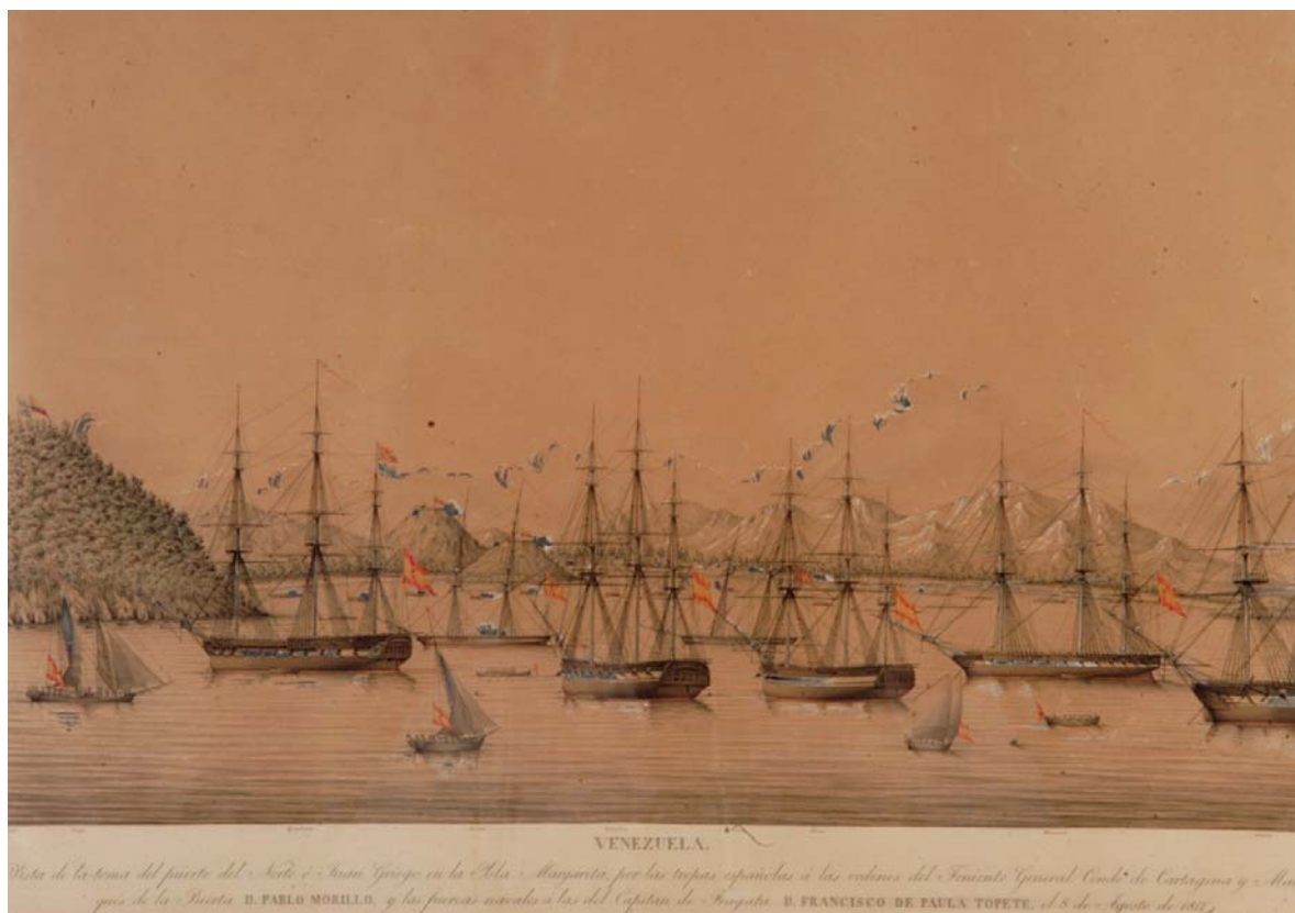
Campaña de Venezuela. Toma del Puerto del Norte o Juan Griego, en la isla Margarita, por las fuerzas navales y terrestres españolas a las órdenes del teniente general Pablo Morillo (8 de agosto de 1817)..

Desde esta fecha hasta el 17 de febrero de 1815 estuvo la tropa destinada a la expedición acuartelada y vigilada para evitar desertiones, anunciándose todos los días su salida para el día siguiente ante el disgusto de las propias tropas y su general en jefe. La expedición se haría a la mar, finalmente, dicho día 17 de febrero. Se hallaba compuesta de 10.000 hombres efectivos. En