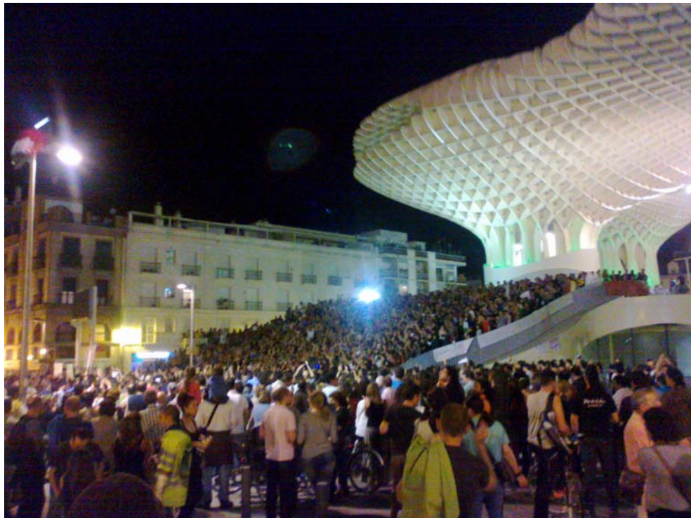
Fig. 1. Manifestación del 11M en el Metropol Parasol, Sevilla (Martínez Ponce 2011)