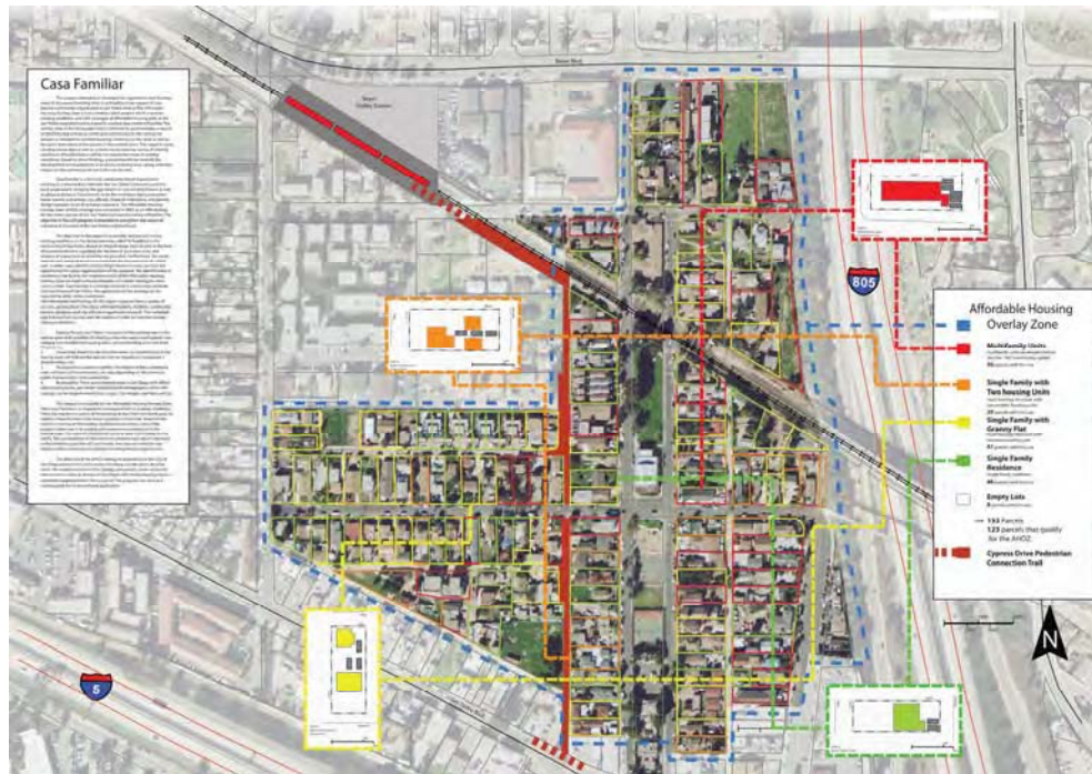
Fig.4. Análisis de las edificaciones ilegales existentes en el barrio de El Pueblito, San Ysidro (San Diego) previo a la definición de la nueva ordenanza AHOZ (Casa Familiar)

ayuntamientos. Estos cambios buscan beneficios comunes para todos los vecinos, aprovechando densidades no utilizadas y modificando el concepto habitual de “número de viviendas por hectárea” hacia el de “intercambios sociales por hectárea”, que permite a los residentes definir su propio entorno en función de las necesidades particulares, y alcanzar así su derecho a vivir la ciudad [13].