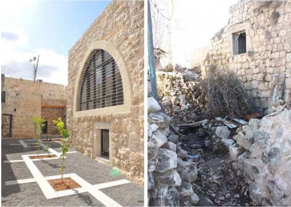
Fig.3. Rehabilitación del centro histórico de Birzeit, patio de la Universidad (AKAA/Riwaq 2013)