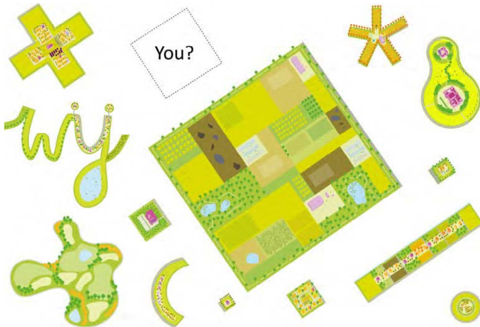
Fig.5. Libertad de usos y de formas en la ordenación urbana de Almere Oosterwold (MVRDV 2012)

Who: you What: change Where: the city When: now How: do it yourself