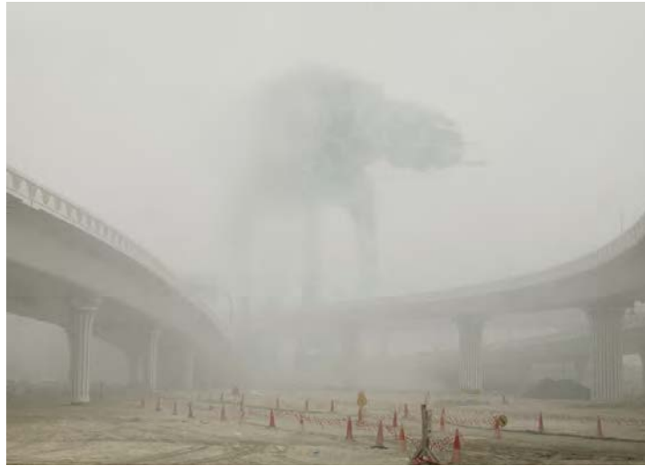
Fig. 1. AT-AT in fog, Dubai. Dark Lens (Cédric Delsaux, 2009)