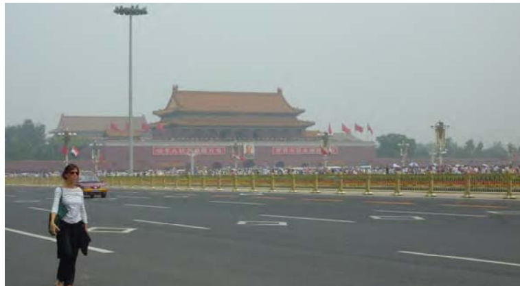
Fig. 2. Plaza y Puerta de Tiananmen, Pekín (Antonio Silva, 2011)

de la plaza hace que ésta pueda considerarse a su vez un espacio de representación, el espacio que habla y que vibra, configurando un escenario idóneo para la observación de fenómenos alternos de dominación y apropiación, en cuanto a espacio dominante y dominado-apropiado, explicados por Lefebvre desde una óptica marxista que sin embargo el propio Marx no llegó a definir claramente. Si aquí se habla sobre todo del espacio dominado-apropiado, tanto en el sentido de sumisión a lo tecnológico y a las fuerzas de trabajo como en el de apropiación social, también es interesante contemplar en segunda instancia la plaza como espacio dominante, es decir, como “la realización de un proyecto maestro” [22]. La plaza puede ser el escenario de la democracia, pero también puede ser el de las demostraciones de poder autoritario, incluidos los desfiles militares y las ejecuciones públicas; o el de la protesta y la insurgencia, bien por extensión del espacio de poder, o bien por la reacción contra lo que éste supone en el segundo. Podría decirse que no existe en realidad tal dialéctica entre espacio dominante y dominado, sino que esta doble condición contradictoria está presente en el espacio público.