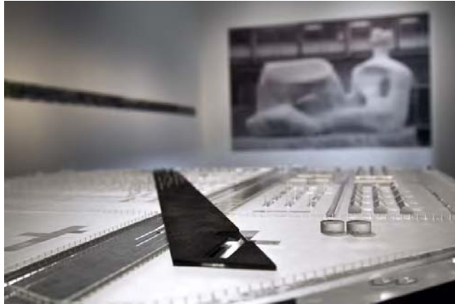
Fig. 7. Maqueta del proyecto del equipo de Oskar Hansen para el memorial de Auschwitz, en la exposición "Moore & Auschwitz", Tate Britain, Inglaterra. (Magdalena Hueckel, 2010)