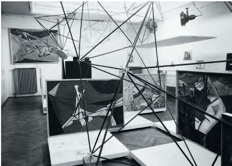
Fig. 5. Exposición individual de Oskar Hansen en el Museo Judío de Varsovia