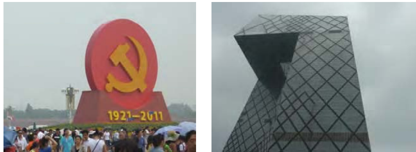
Fig. 3. Izquierda: Monumento al Partido Comunista Chino en su centenario, Plaza de Tiananmen. Derecha: Sede de la CCTV, OMA. Pekín.