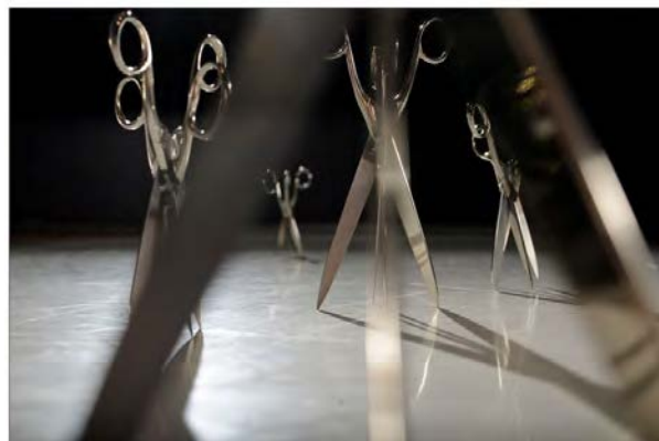
Fig. 8. Scherentänzerinnen , Valie EXPORT. (Lukas Beck, 2008)

La ciudad, como forma de exterioridad, ve continuamente redibujados sus límites público y privado, todo lo que de afuera -de exterior, fuera de la casa- posee. La experiencia del espacio público es imprescindible a la hora de reclamar esa exterioridad, para no convertirnos en cuerpos sin espacio, sino cuerpos en el espacio, o más bien cuerpos que habitan el espacio [40]: no absorbiendo lo Otro, sino vinculándonos a ello. Centrar en este momento la atención en un emplazamiento específico como Estambul posee una doble motivación: por una parte, estudiar un caso muy concreto de reclamación de un espacio público desde el propio espacio público –ambos comprensibles desde su dimensión tanto urbana como política- en un marco cuyas características postpolíticas se acrecientan con el tiempo; y por otra, detectar formas de contraespacialidad en los procesos que han tenido lugar en la ciudad durante los últimos años. Concretamente, es en este entorno geopolítico donde Cacciari parece situar la aparición del conflicto y la división entre Este y Oeste, el reconocimiento del otro, a través de la inescindibilidad, y a su vez, la alteridad entre los dos territorios, Asia y Europa [41] en el sueño de la reina Atosa.