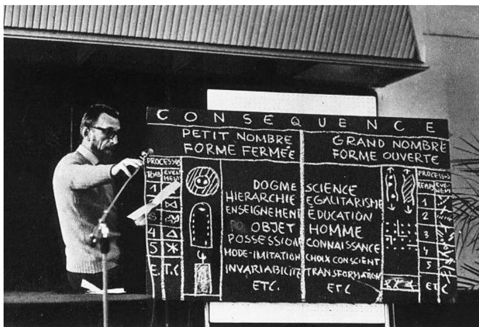
Fig. 6. Oskar Hansen exponiendo la Teoría de la Forma Abierta (Museo de Arte Moderno de Varsovia, 2013)