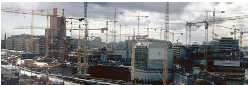
Fig 7. Postdamer Platz, Berlín, abril de 1997. Paroxismo obliterador

Aunque practicado en un número siempre creciente de ciudades, el ejemplo más evidente de este tipo de actuación quizá sea la remodelación del entorno de la Postdamer Platz, en Berlín. En ella se produjo, con gran estruendo publicitario, la convergencia de un buen número de potentes multinacionales y empresas semi-públicas en la total, casi obsesiva obliteración de cualquier rastro del traumático pasado reciente del lugar, atrapado en el mismo eje del telón de acero, en primera línea del frente de batalla del capitalismo y su extinto opuesto 15 .