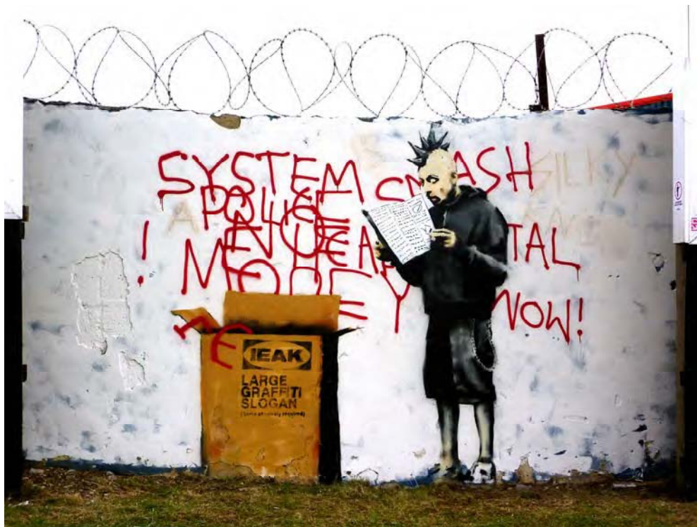
Fig 8. Graffiti atribuido a Ralph Basky, en Croydon, Londres

Žižek describe la situación con la diatriba cruel entre el pícaro y el tonto: "Caído el régimen comunista, el pícaro es el neoconservador defensor del libre mercado, aquel que rechaza crudamente toda forma de solidaridad social por ser improductiva expresión de sentimentalismos, mientras que el tonto es el crítico social "radical" y multiculturalista que, con sus lúbricas pretensiones de "subvertir" el orden, en realidad lo apuntala" [34].