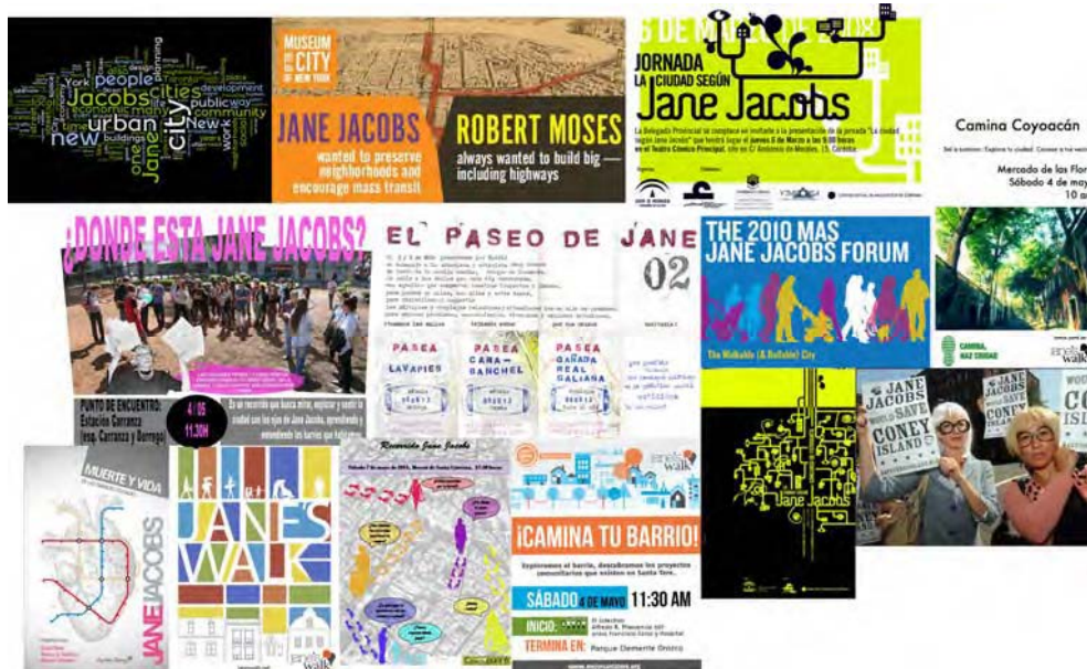
Fig 1. Imágenes de revivalismo de Jane Jacobs, todas ellas posteriores a la crisis de 2008, y la portada de la reciente reedición de su libro "Muerte y vida de las grandes ciudades" -americanas, incluía el original- que alcanzó casi inmediatamente su segunda edición [1] (elaboración propia).

Desde el comienzo de la crisis de 2008, se ha producido un generalizado refloramiento de los movimientos de participación ciudadana y urbanismo "bottom-up". Partiendo de una postura pretendidamente contestataria, la tendencia ha ido generando un consenso que ya alcanza cotas de hegemonía, monopolizando buena parte del debate y, en no pocos casos, rechazando posibles ideas alternativas como demodé y antidemocráticas.