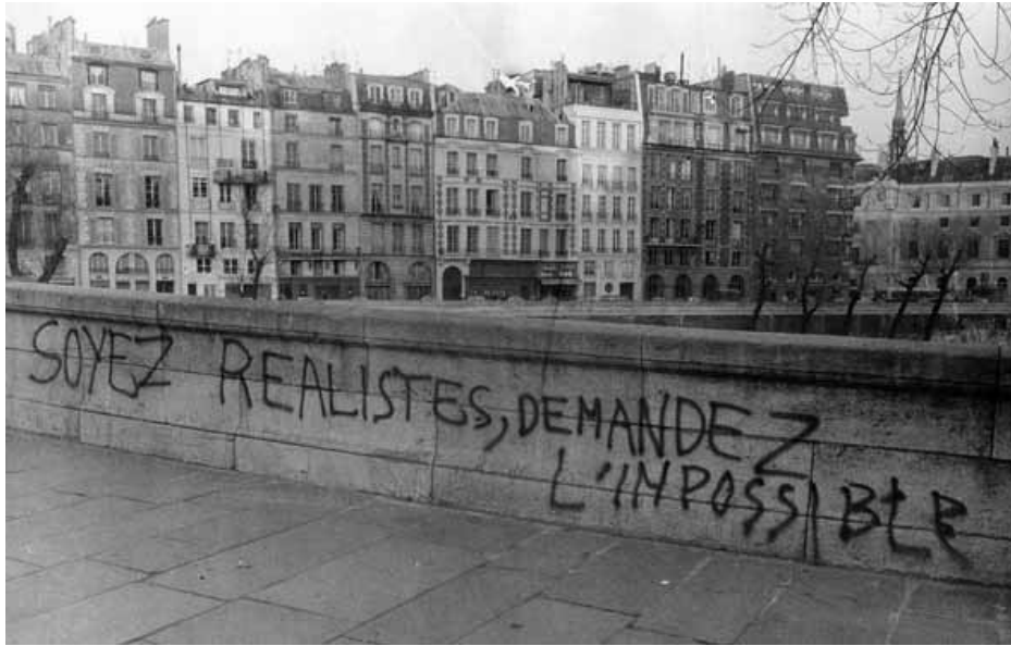
Fig 3. "Sean realistas, pidan lo imposible". El evocador lema de mayo del 68, a la luz de lo expuesto por los autores citados en estos párrafos bien podría leerse desde el lado del nuevo mercado: "pidan (inventen, diseñen) lo imposible, para que podamos hacerlo real... y vendérselo".

Pero no es necesario ceñirse al mayo del 68 francés. Podemos encontrar autores de opiniones semejantes en un sinnúmero de ámbitos, tantos, que ello podría constituir una investigación en sí misma, y no una breve. En el lado americano, Thomas Frank advierte que "si realmente queremos entender la sociedad norteamericana de los años sesenta, al menos debemos reconocer la posibilidad de que las fuerzas asimiladoras estuvieran en lo cierto y que, de algún modo, la idea que Madison Avenue 5 tenía de la contracultura era correcta" [11]. ¿Y cuál era esta idea? Según él "la contracultura sirvió a los empresarios visionarios como una forma de proyectar los nuevos principios de la empresa, y vieron en ella la encarnación de unas actitudes que reflejaban las suyas.[...] Sus anhelos de autenticidad y su simultánea desconfianza hacia la tradición convertían la contracultura en un vehículo ideal para transformar radicalmente los hábitos de consumo de los estadounidenses. Los líderes de las industrias de la moda masculina y de la publicidad utilizaron los símbolos y mitos de la contracultura para idear un consumismo notablemente distinto al de los años cincuenta, un consumismo moderno generado por el desencanto hacia la propia sociedad de masas" [12].