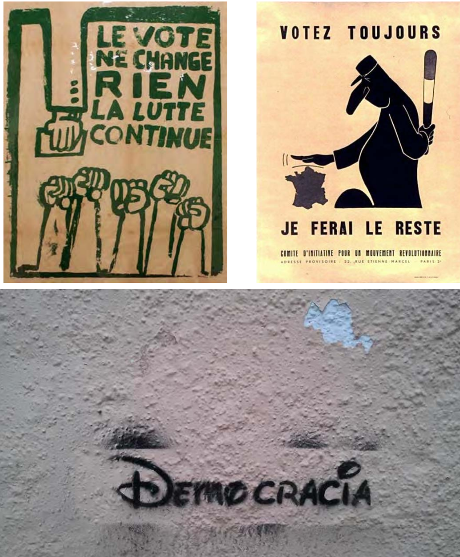
Fig 6. Arriba, cartelera de mayo del 68 francés (a la izquierda: Galería flickr de °WYZ°, recortada; a la derecha: Wikimedia Commons). Abajo, pintada callejera actual (foto del autor). Situadas en ámbitos potencialmente recidivantes (ver fig. 1), ambas comparten un descreimiento de la democracia, aunque por motivos acordes a sus distintas épocas. Si las primeras aluden a la manipulación por parte de un Estado paternalista, la segunda se refiere más a una ocultación espectacular y festiva, pero también taimada, por parte de las empresas multinacionales, incluso las aparentemente más inocentes. Sus resultados no son menos dañinos por menos evidentes.

adecuado desarrollo. La decisión política queda, pues, excluida o reducida a una mera representación, frecuentemente, de corte populista.