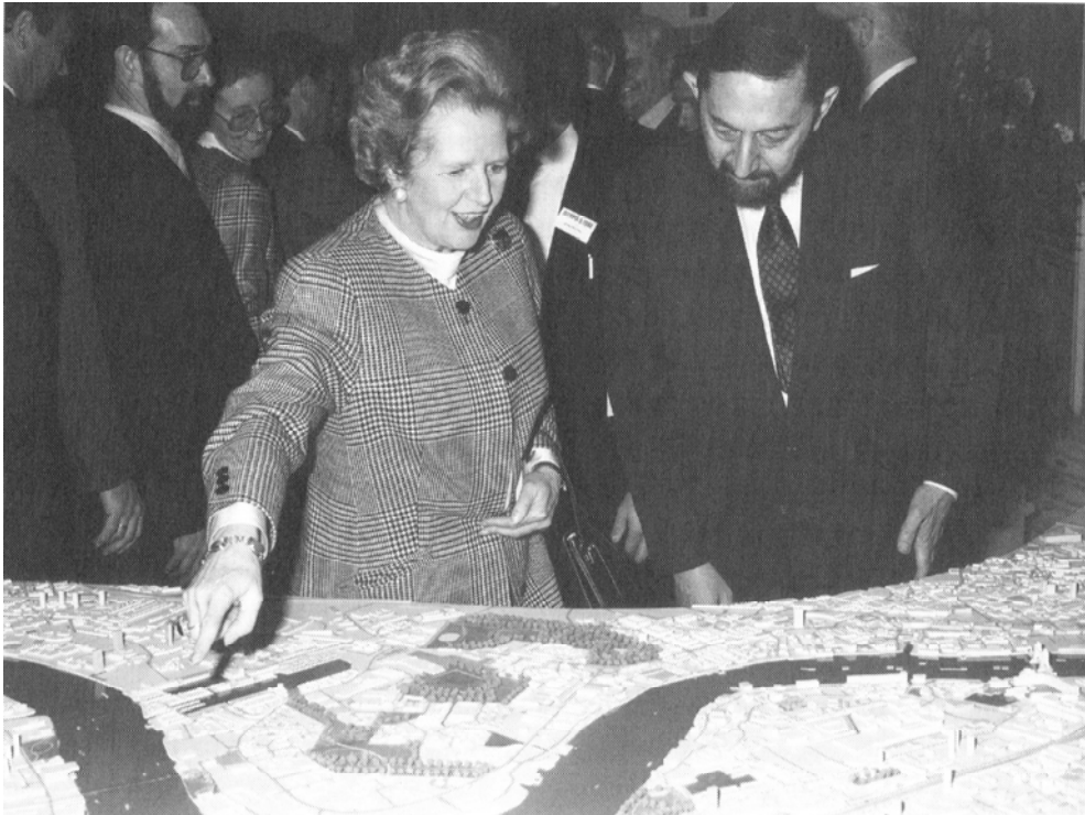
Fig 5. Margaret Thatcher supervisando el diseño de Canary Wharf, Londres 1988

La connivencia de "Non-Plan" con las ideas del mercantilismo liberal se materializó años más tarde, cuando uno de los autores del original, desarrolló a partir de él la idea de las "zonas empresariales laissez-faire ". Ofrecida por Peter Hall en una conferencia en 1977, dicha idea fue retomada, a través de Sir Keith Joseph y Geoffrey Howe, para la administración Thatcher, y aplicada en los Docklands londinenses en 1980. Se generó una zona de urbanismo desregulado y exenciones fiscales para las empresas inversoras cuyos resultados no son sólo cuestionables en lo urbano o espacial, sino que incluso supuso la quiebra de alguna de las inmobiliarias más implicadas, como Olympia and York, responsable de Canary Wharf, la parte más "noble" de los Docklands [22].