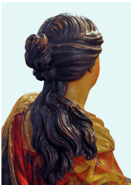
Figura 7. Virgen del coro del convento de Madre de Dios de Sanlúcar de Barrameda. (detalle).