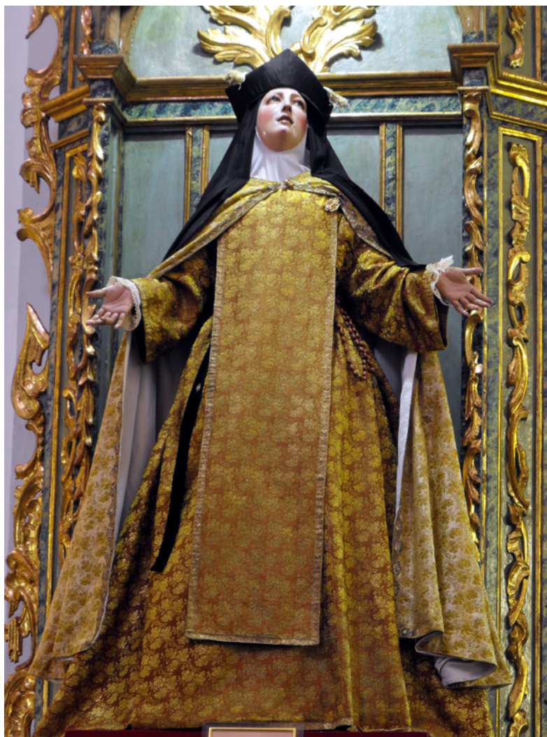
Figura 9. Sata Teresa de Jesús de la parroquia del Carmen de Sanlúcar de Barrameda.