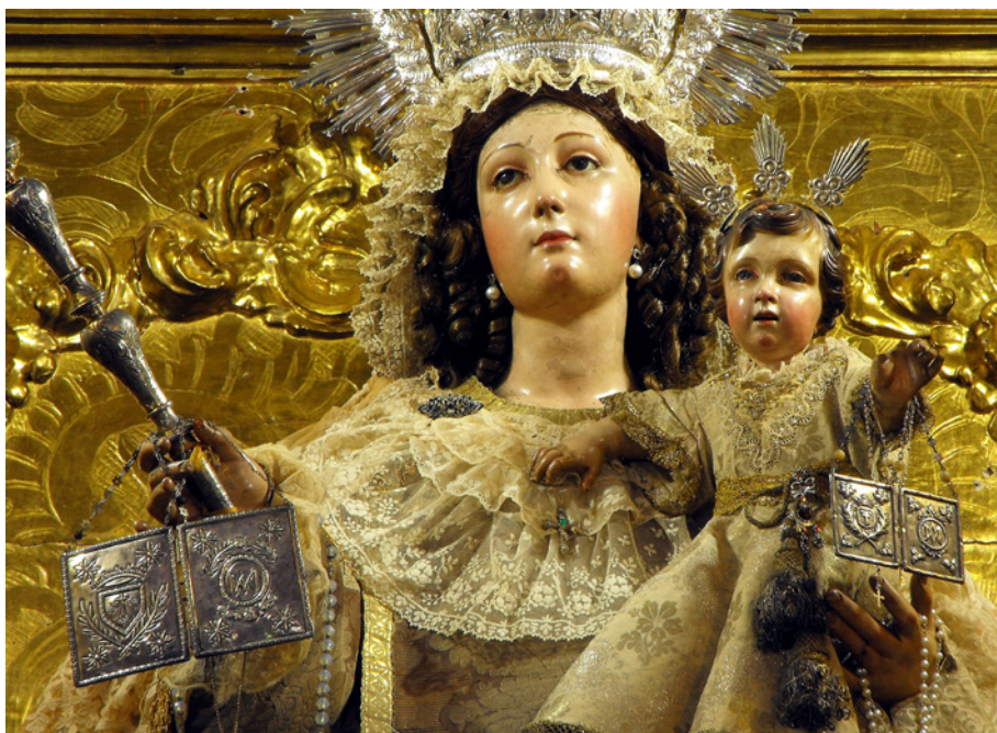
Figura 8. Virgen del Carmen de la parroquia del Carmen de Sanlúcar de Barrameda.