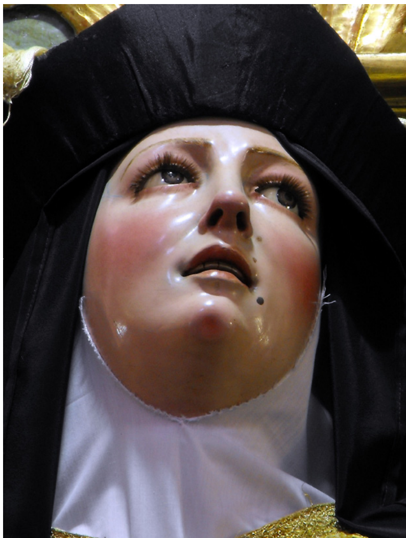
Figura 10. Santa Teresa de Jesús de la parroquia del Carmen de Sanlúcar de Barrameda. (detalle).