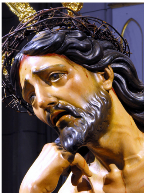
Figura 4. Cristo de la Humildad y Paciencia. Santuario de Nuestra Señora de Regla de Chipiona (detalle).