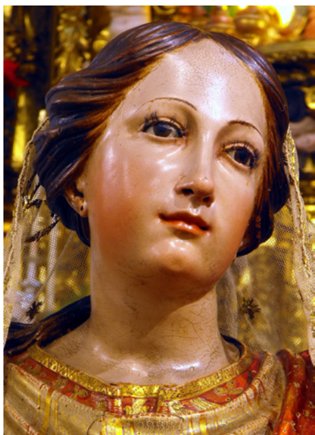
Figura 6. Virgen del coro del convento de Madre de Dios de Sanlúcar de Barrameda. (detalle).