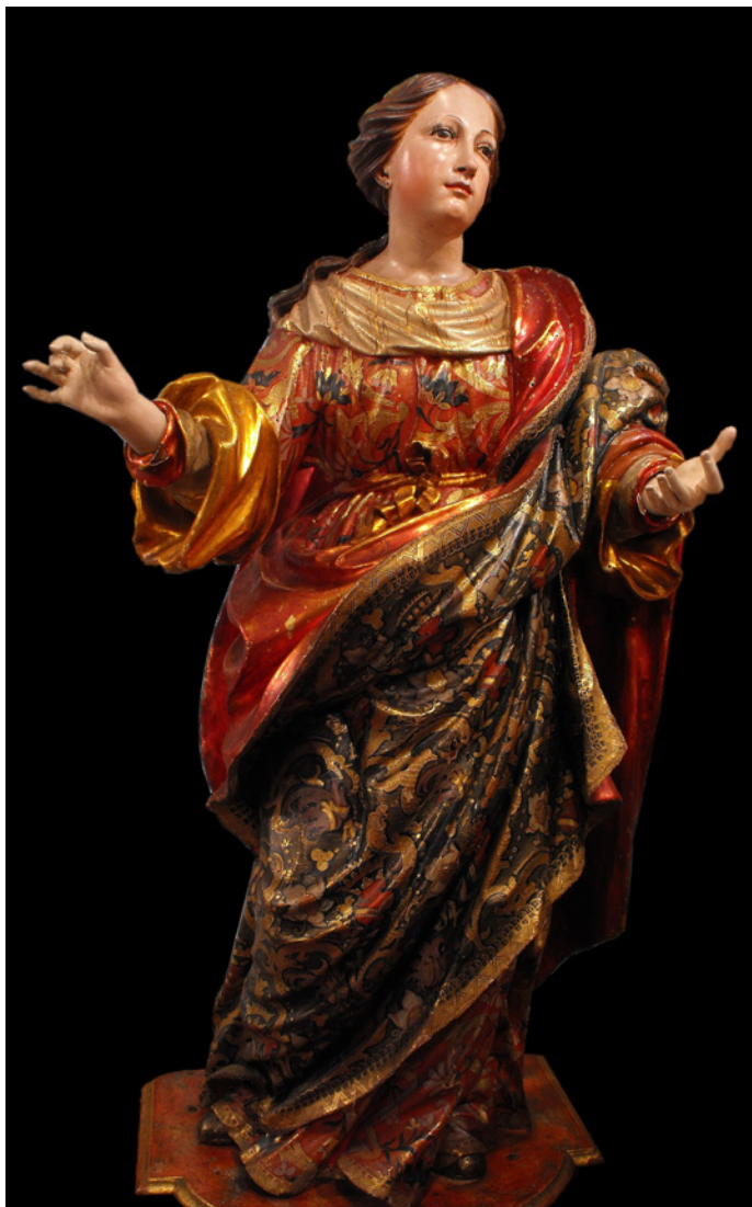
Figura 5. Virgen del coro del convento de Madre de Dios de Sanlúcar de Barrameda.