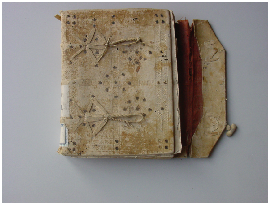
Encuadernación del libro 211.

Dado que los textos que se recogen en el libro pertenecen a fechas muy diversas de los siglos XV y XVI, la datación del códice ha de hacerse mediante el análisis de los elementos externos. Este análisis nos ha llevado a considerarlo como una pieza de factura bajomedieval, es decir, que fue elaborada un siglo antes de que se copiara en él el inventario objeto de este estudio. En primer lugar encontramos una encuadernación de tipo mudéjar, de larga tradición en las artes del libro, pero donde el papelón del interior de las tapas, que hoy es visible, se confeccionó con papeles del siglo XIV. En segundo lugar analizamos la filigrana del papel, cotejándola con el repertorio de Briquet 23 , que es el más usado para las filigranas anteriores al siglo XVI, y con las del portal de Bernstein 24 , que recoge varias bases de datos de filigranas. Las figuras más próximas a nuestro unicornio (en realidad, la mitad superior de un unicornio en posición rampante) las localiza Bernstein entre los años 1399 y 1424, fechas muy próximas a las que registra Briquet, entre 1370 y 1407.