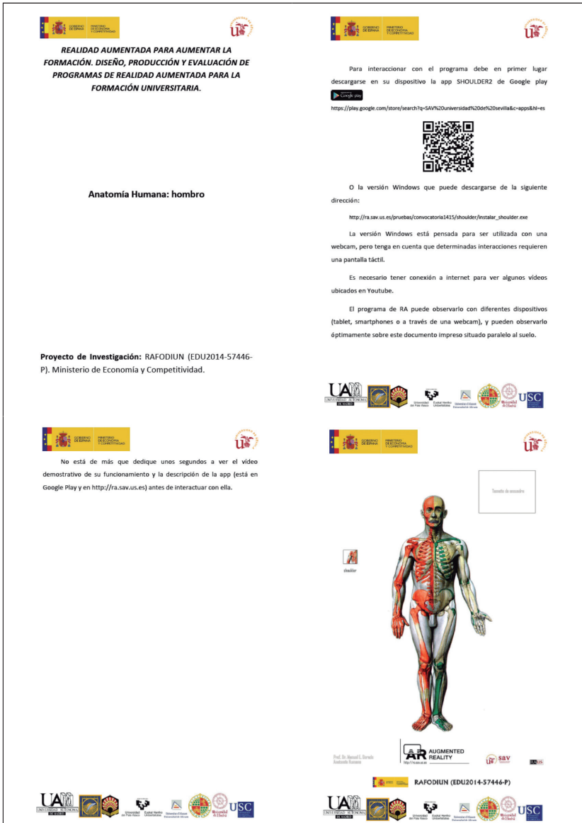
FIGURA 4 Guía objeto Shoulder