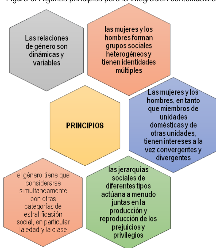
Figura 3: Algunos principios para la integración contextualizada del enfoque de género