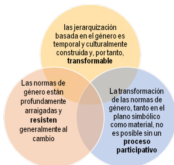
Las ideas básicas detrás del African Transformation Gender Tool

Por último, Jane Brown (2012) nos muestra una herramienta interesante, inspirada en el concepto de "concienciación" de Paulo Freire, en la teoría del aprendizaje social de Albert Bandura y en el concepto de "comunicación ritual" de James Carey (Underwood et al., 2011, citados por Brown, 2012: 19). Se trata del African Transformation Gender Tool que se puso en práctica con la ayuda de la cooperación estadounidense (USAID) para "promover el desarrollo participativo, la igualdad de género y la agencia humana" (Brown, 2012: 19). La siguiente figura muestra las tres ideas esenciales que inspiraron esta herramienta.