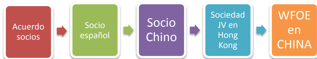
Figura 8.1. Pasos para realizar un holding off shore en Hong Kong

De esta forma se puede conseguir una zona de fácil acceso, con menos impuestos y trabas legales desde la que acceder a China.