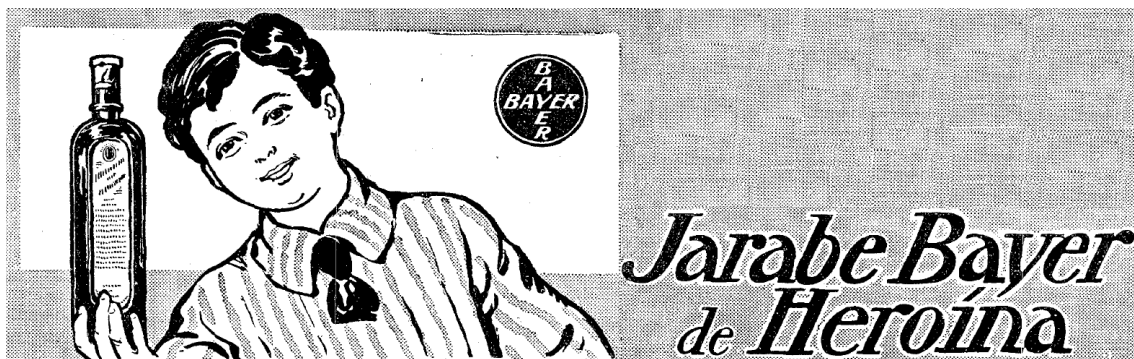
Figura 4. Ejemplo de ilustración que acompañaba a los anuncios del jarabe Bayer de heroína.