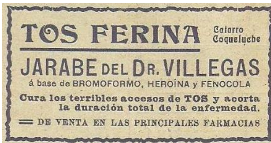
Figura 5. Anuncio del jarabe del doctor Villegas.

Considerando que el doctor Palomares recibió mucha influencia de la sociedad inglesa, resulta útil conocer como era tratada la coqueluche en la Inglaterra de finales de siglo XIX para establecer algún tipo de relación entre los ingredientes utilizados por los doctores ingleses y los