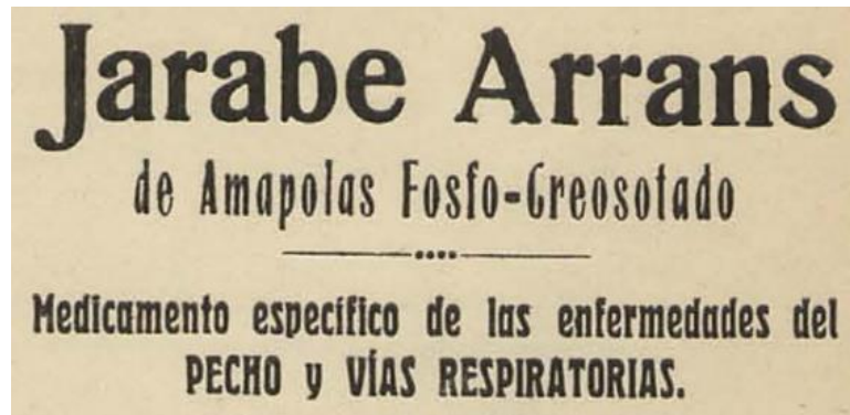
Figura 3. Anuncio del jarabe Arrans.