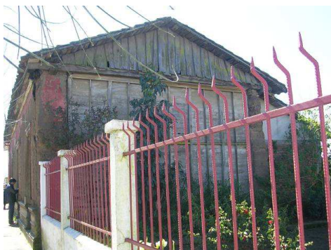
Lateral casa Violeta Parra sin muro de arriostramiento

Un edificio en el que la realización de medidas dinámicas previas y posteriores a su reparación han servido para verificar lo adecuado de los refuerzos estructurales ejecutados es la Iglesia del Salvador de Sevilla.