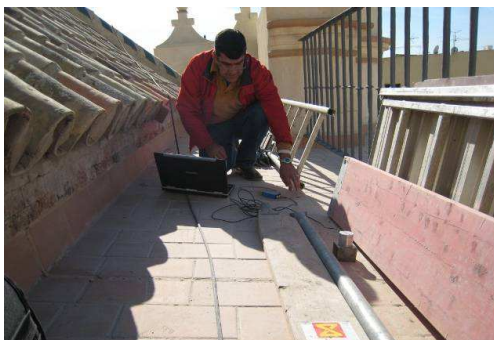
Medidas dinámicas en la cubierta de la Iglesia del Salvador de Sevilla

Para la adecuación, puede permitirse una mejora controlada, reduciendo la acción sísmica hasta un 65% del nivel previsto para las estructuras nuevas, tomando en consideración las tipologías constructivas locales.