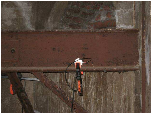
Colocación de un acelerómetro en las torres de la Catedral de Santiago para la medida dinámica