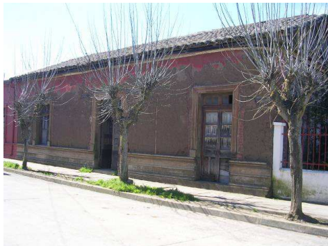
Fachada casa natal Violeta Parra en San Carlos