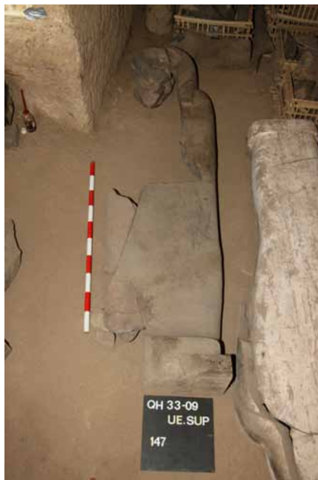
Figura 7. Uno de los sarcófagos de piedra hallado en la QH33

La datación de estos sarcófagos puede estar conectada con la presencia de cerámica de Época Tardía (Dinastías XXVI-XXVII), ya que en periodos precedentes de ocupación (Dinastías XII-XVIII) no se producían este tipo de sarcófagos.