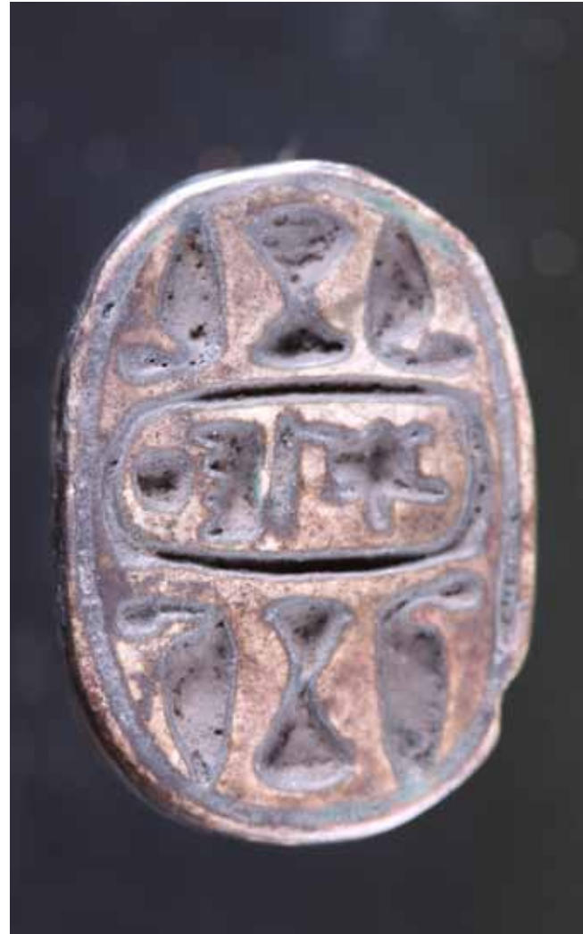
Figura 3. Escarabeo con mención del nombre de Tutmosis III

c) Madera: aunque la mayoría de fragmentos de madera están muy afectados por el fuego, se conservan algunas policromías. La mayoría podrían pertenecer a ataúdes, cajas y estatuas Ptah-Sokar-Osiris. Aunque ninguna de estas últimas ha sido descubierta completa, sí se han documentado fragmentos: cuer-