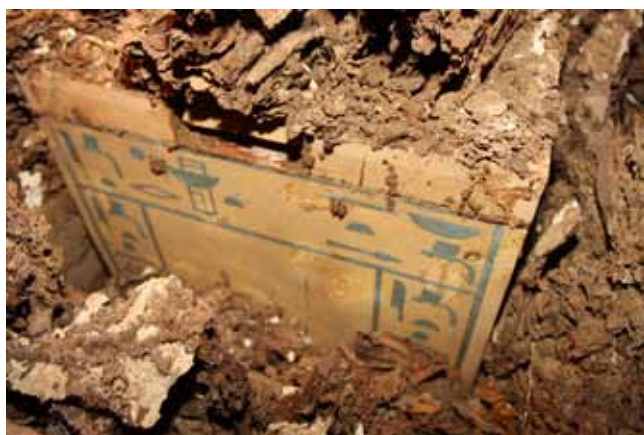
Figura 2. Nueva cámara intacta de la XII Dinastía

Las dos fases siguientes de ocupación de la tumba datan de periodos posteriores, concretamente del reinado de Thutmosis III y de Época Tardía. En ambos