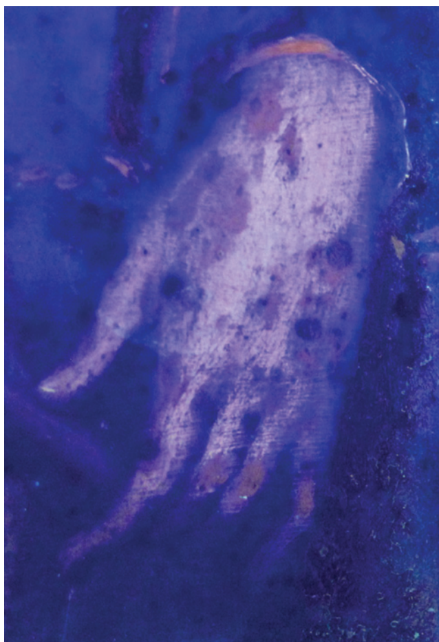
3. B. PRADO-CAMPOS. DETALLE DE LA OXIDACIÓN DE LA LÁMINA DE COBRE CON FORMAS CIRCULARES PROVOCANDO LA PÉRDIDA DE LA CAPA PICTÓRICA. CONCRETAMENTE, CON LA LUZ ULTRAVIOLETA SE OBSERVAN LOS REPINTES QUE SE HAN PRACTICADO INTENTANDO DISIMULAR LA ALTERACIÓN. COLECCIÓN PARTICULAR

La reacción de corrosión del cobre en contacto con el agua y el oxígeno es: 2\text{Cu} + 1/2 \text{O}_2 + \text{H}_2\text{O} \rightleftharpoons 2\text{Cu}^+ + 2\text{OH}^-