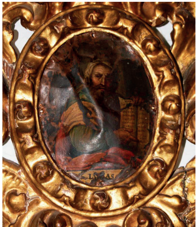
2. A. J. SÁNCHEZ FERNÁNDEZ. ÓLEO SOBRE COBRE. DETALLE DE LAS DEFORMACIONES MECÁNICAS. IGLESIA DEL CARMEN (ANTEQUERA, MÁLAGA)

La mayor fragilidad de la pintura sobre cobre está en la interacción entre la lámina de metal y la capa pictórica. Los levantamientos y la pérdida de policromía están más vinculados a los fenómenos mecánicos que químicos. Así, los levantamientos en escamas de la película pictórica se presentan frágiles y quebradizos. Además, entre las oquedades de las escamas pueden acumularse suciedad o sustancias de intervenciones de restauración. Las escamas de bordes rizados son el caso extremo que conduce a la caída final de la pintura. También existen levantamientos en forma de burbujas, que aunque parezca una patología localizada, son síntomas de patologías más extensas.