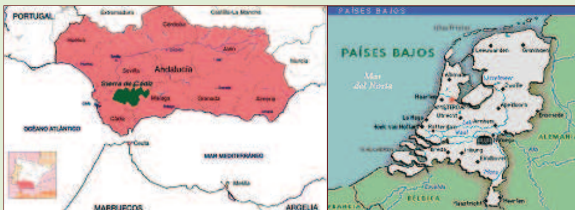
Figura 1: Localización de la Sierra de Cádiz y Frisia.