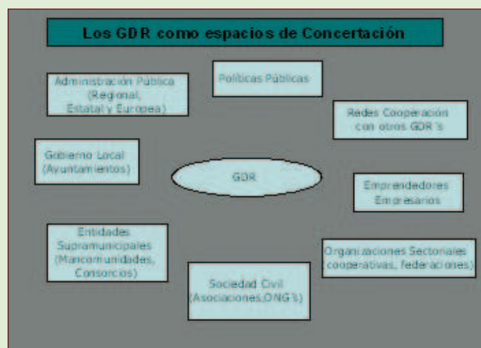
Gráfico 1: Los GDR como espacios de concertación.

1. Relación y sinergia interinstitucional: lo centraremos en los nuevos sistemas institucionales constituidos para el fomento del desarrollo rural a nivel comarcal. Estos sistemas institucionales constituyen redes de organizaciones, entendidas como el conjunto de actores que persigue colectivamente unos objetivos comunes (Ramos y Delgado, 2002) y también como todo actor local con poder suficiente como para influir en el proceso de toma de decisiones. Destacaremos el papel que dentro de estas redes poseen los GDR como espacios de concertación entre el resto de las organizaciones vinculadas con el desarrollo rural.