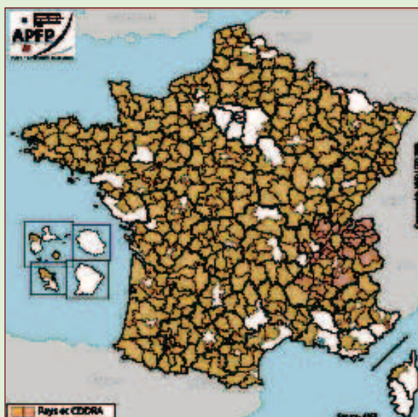
Imagen 3. Les Pays en Francia.

En este aspecto y a pesar de las diferencias existentes entre países de la UE, vemos que la tendencia de construcción de nuevas demarcaciones espaciales de las zonas rurales ha sido generalizada. En Francia existen en la actualidad 346 Pays reconocidos, que cubren el 80% del territorio nacional y amparan al 46% de la población francesa. En el periodo Leader+, el 89% de los GAL se ajustan a la demarcación espacial de los «Pays» aunque solamente el 51% corresponden a un sólo Pays. Concretamente en la región de LanguedocRoussillon el 100% de los GAL son gestionados por «Pays» y más del 80% de los «Pays» son a la vez GAL.