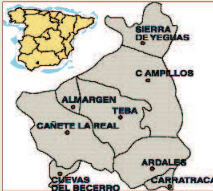
Imagen 1. Comarca de Guadalteba.

La metodología de investigación aplicada en ambos casos de estudio se ha basado en el análisis documental, el trabajo de campo y la realización de entrevistas semiestructuradas con informantes de distintos perfiles (representantes políticos, técnicos de desarrollo, representantes de entidades sociales, portavoces de agrupaciones sectoriales (sindicatos, cooperativas), empresarios y emprendedores), en un total de 71 entrevistas, así como 5 grupos de discusión.