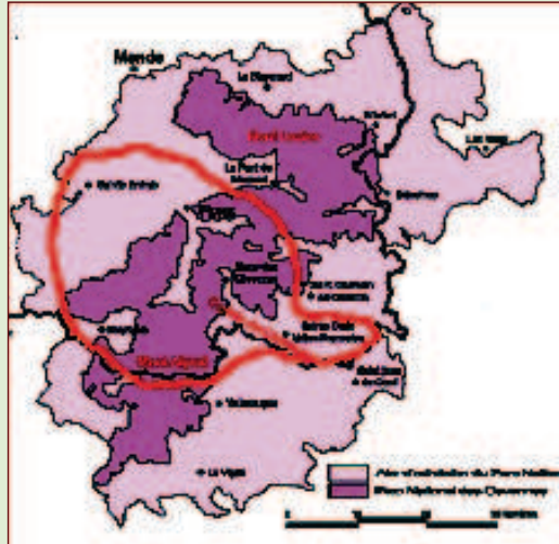
Imagen 2. Le Pays Gorges, Causses, Cevennes.

El Pays Gorges, Causses, Cevennes de la región francesa del LanguedocRousignon está constituido por 5 communautés de communes 2 (31 communes en total). Se constituyó como Pays en 2006 y está gestionado por el GAL Terres de Vie, que abarca también la gestión de otro Pays vecino: Le Pays de Sources en Lózere. Tiene una extensión de 1.100 km 2 y una población aproximada de 10.000 habitantes.