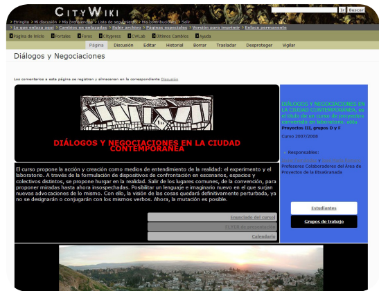
Página principal del curso Diálogos y Negociaciones

Los paisajes semánticos son herramientas de laboratorio, visores especializados con la que evaluar y descodificar los documentos, elementos y trazas obtenidos tras una inmersión. La inmersión consiste en entrar en el lugar sin misión superior a la de estar y pertenecer instalado en su interior y, así, compartir e intercambiar con lo que allí hay, para no hablar de lo que otros dicen sino decir con los demás. Con estas muestras disímiles, tomadas de aquí y de allí, se construyen -en este caso- los paisajes. Una y otra vez se montan. Para cada uno de ellos, se hacen observaciones, se buscan confrontaciones y conclusiones. A través de ellos, se atrapa por un instante tiempos líquidos (Z. Bauman, 2007)