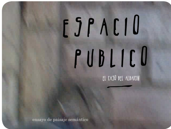
Ensayo de paisaje semántico

También, se han ensayado colecciones de paisajes que actúan a la postre como uno más de ellos. “¿Dónde está ahora el valor? Posiblemente en el filtrado, la agregación y la remezcla y en la conexión intelectual y emocional con los usuarios. Llega la era de los comisarios digitales (algunos de ellos actuando como brokers de conocimiento)” 6 . En la línea de la emergente posición del “curator” digital, se componen estas colecciones o selecciones de material producido y depositado por los estudiantes. Para la descripción de un tipo heterogéneo de vecinos se recurre a una colección 7 de paisajes que giran alrededor de la gastronomía y un concurso vecinal de tapas o aperitivos. Y finalmente, todo el material producido se refunde en el Portal:Albaicín 8 . Paisaje semántico que cristaliza la contemporaneidad de nuestra inmersión.