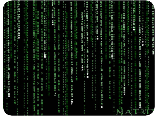
Matrix. ( http://jcwinnie.biz/wordpress/imageSnag/matrix.jpg )

ciencia no se encontrará en cualidades cognitivas, sociales o psicológicas, sino en la especial construcción de los laboratorios, donde se invierte la escala de los fenómenos para que las cosas puedan leerse, y después acelerar la frecuencia de las pruebas, permitiendo que se cometan y registren muchos errores.” (Latour, 1983). El interés es ensayar un método de trabajo basado en estos antecedentes. Construir una senda de conocimiento a través de la utilización de visores en el laboratorio. Nuestra aportación en este campo, le hemos denominado paisajes semánticos.