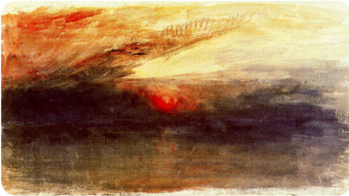
Crepúsculo con nubes oscuras. William Turner, 1826 ( http://pintura.aut.org/SearchProducto?Prodnunum=28100 )