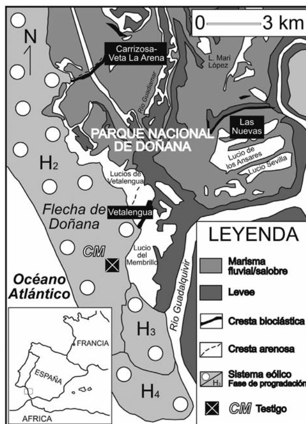
Fig. 1.—Geomorfología general del sector meridional del Parque Nacional de Doñana, con la localización del testigo CM. En negrita, nombre local de determinados sectores del Parque (p.e., Las Nuevas).

Los 3 metros inferiores del testigo CM están constituidos por limos glauconíticos con algunos niveles lumaquéllicos de ostreidos. Los ostrácodos