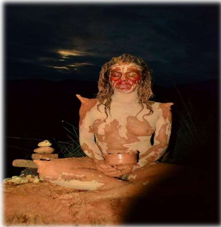
Figura 6. Ritual de contemplación (Ser tierra)

“EL CUERPO UNA SUPERFICIE PARA INTERPRETAR EL PODER QUE TIENE EN SÍ MISMO”