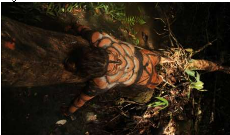
Figura 13. Registro

para re significar las materias orgánicas anteriormente mencionadas al plasmarlas en mi piel, el trabajo inicio planteando que los vestigios de las materias orgánicas son fundamentales para re significar el hecho tan trágico ocurrido semanas antes, y que el cuerpo del artista es quien puede transformar este hecho tan sensible en una acción de resistencia ante estas fuerzas naturales que impactan de maneras tan agrestes nuestros paisajes y zonas de bosques, decidimos plasmar en la piel elementos figurativos que pudieran ser una mimesis con los posibles animales que murieron en el incidente del incendio, pájaros, serpientes, roedores, gatos de monte, insectos, entre otros, y con las materias organizas lo logramos plasmar, anterior a ello habías realizado una acción de despertar la animalidad del ser, al estar inmerso en ese paraje tan natural, decidimos en mutuo acuerdo invocar al poder del jaguar, animal poderoso mitológico, asociado al trueno y al fuego, en las culturas amazónicas de Colombia, en esta acción dibujamos en mi cuerpo una superficie simbólica una serie de grabados con cenizas, barros, achotes, y demás materias, los dibujos realizados por el dibujante eran dibujos de figuras geométricas haciendo alusión a escamas, plumas, o en la parte superior del tronco y los senos, en el rostro se dibujaron líneas y figuras geométricas señalizando el flujo del rostro como un devenir del adentro y del afuera simbolizando todo lo que está en lo exterior o lo interior del ser.