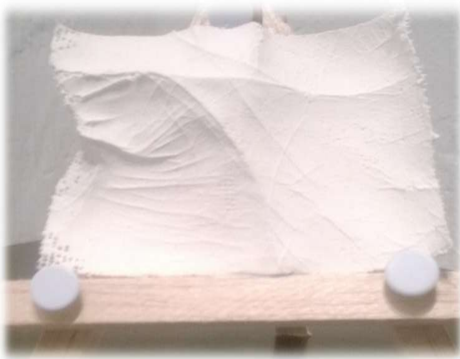
Figura 4. Cartografía de mano de Abuela Sixta edad 86