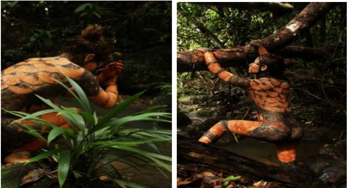
Figura 15. Registro