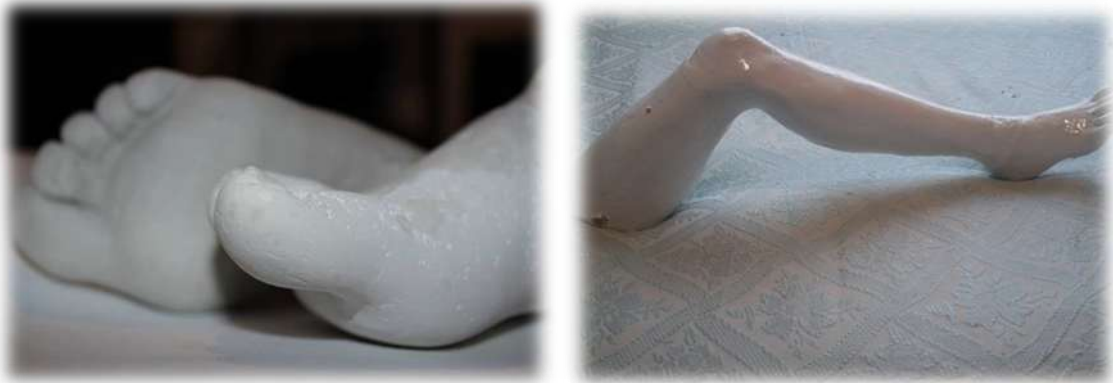
Figura 3. Registro