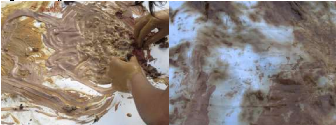
Figura 7. Registro

Forma un ritual y un altar con materiales del mismo lugar para luego sentarme a meditar sobre la tierra en la que estaba inmersa, desde mi posición veía el oriente y frente a mis ojos las montañas alineadas creando una gran circunferencia en la cual el círculo terminaba en frente a mis ojos, como cerrando una gran círculo en el territorio donde puede percibir el poder de la tierra, sentada y desnuda frente a mis ojos veía como las montañas se dividían justo frente a mis ojos, e imaginaba en la posición las montañas donde emergía un parto de la creación de la tierra la gran madre creadora de toda la naturaleza, use unos calazos y un caracol modelando en la tierra una escultura andrógono que era masturbada como un caracol en espiral que fecundaba la tierra Un ritual maravilloso que me hizo entender el territorio y los materiales más sutiles para mimetizarme junto a ella.