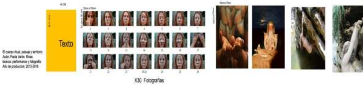
Figura 16. Registro