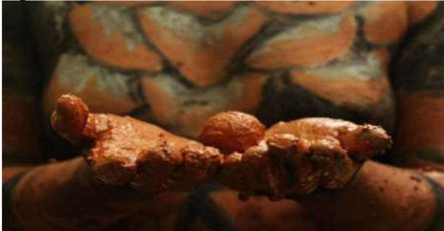
Figura 14. Registro