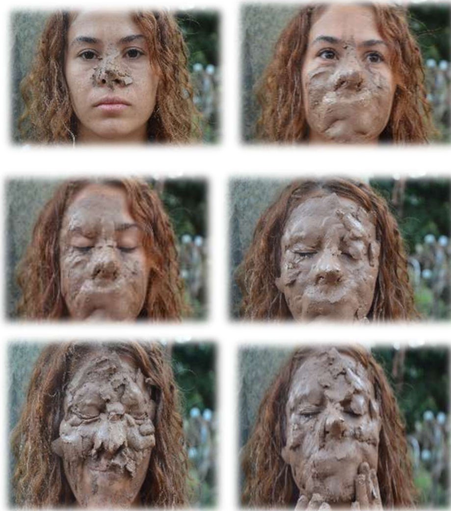
Figura 8. Registro