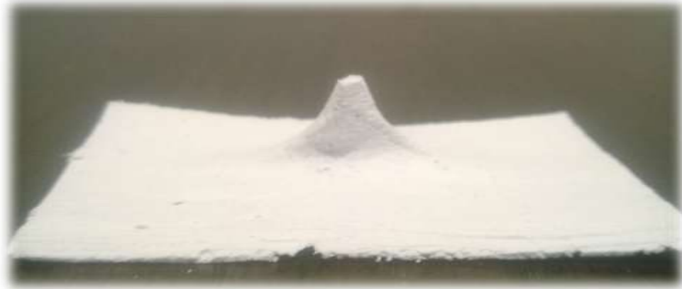
Figura 5. Cartografía del ombligo de Rosabel Rivas Edad 61 (mamá)