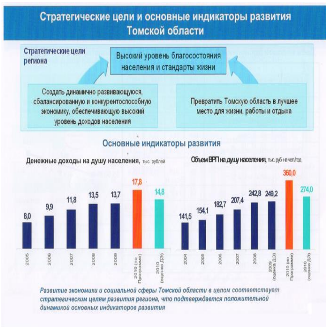
Рисунок А.1 – Стратегические цели и основные индикаторы развития Томской области