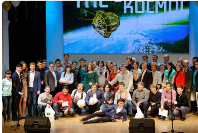
Рис. 4. Закрытие форума «Космическое приборостроение»

техники с применением средств автоматизированного проектирования» предлагается и школьникам города Зеленогорска Красноярского края в рамках «Школы инженерных проектов» в октябре 2016 года. Еще одно из направлений работы со школьниками – организация экскурсий на кафедру ТПС и другие подразделения ИНК. На кафедре школьники знакомятся с деятельностью ВКБ и кафедры ТПС [3, 4].