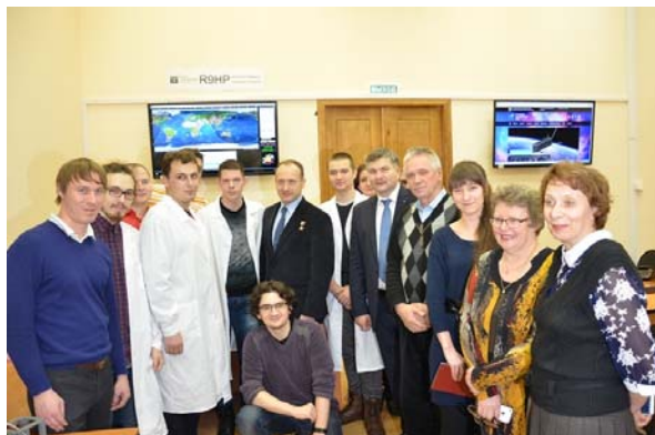
Рис. 11. Встреча с героем России, действующим космонавтом-испытателем А.А. Мисуркиным

Действующий космонавт-испытатель Александр Мисуркин 7 декабря 2016 года встретился со студентами-политехниками в молодежном Центре управления полетами (ЦУП), организованном в Томском политехническом университете. Студенты вместе с космонавтом вышли на радиосвязь с российским экипажем Международной космической станции (МКС) и задали несколько вопросов космонавтам.