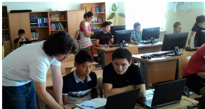
Рис. 5. Фотография с летних курсов по 3D моделированию в Назарбаев интеллектуальной школе физико-математического направления г. Семей, Р.Казахстан, проведенных с 17 по 22 августа 2015 г

Ребята знакомятся с преподавателями и студентами кафедры, оборудованием, лабораторными установками, которые используются в учебном процессе. Подлинный интерес школьников вызывает компьютерный класс с программным обеспечением по 3D-моделированию и проектированию, а также все связанное с применением 3D-печати – 3D-принтеры, 3D-сканеры, модели, напечатанные с их использованием.