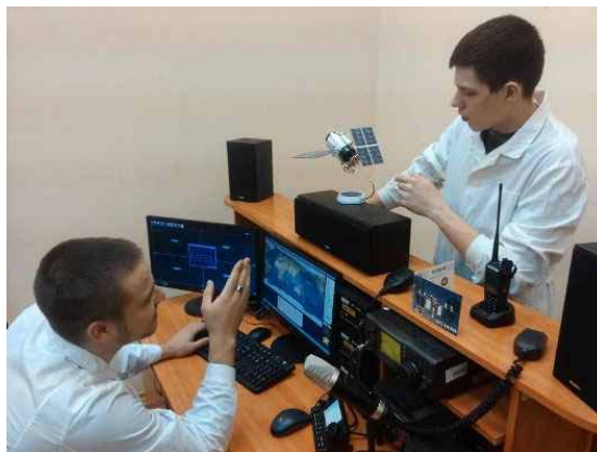
Рис. 6. Операторы ЦУПа на рабочем месте