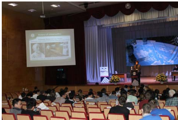
Рис. 3. Доклад ТПУ на Форуме малых спутников

Так было положено начало сотрудничества кафедры и ОАО РКК «Энергия» – ведущей российской космической корпорацией. В тот год студенты кафедры были направлены на производственную практику в Москву, Санкт-Петербург и Железногорск. Набравшись опыта, вернувшись с новыми силами продолжили работу над проектом Студенческого малого спутника и его элементами. В апреле 2014 года результаты работ были представлены на Форуме малых спутников Ассоциации технических университетов России и Китая. На этом Форуме проект ТПУ занял почетное третье место [2].