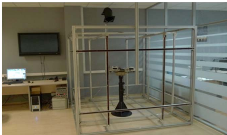
Рис. 1. Стенд SX-025

Все указанные стенды имеют идентичную структуру работы, которую можно рассмотреть на примере стенда SX-025 (рис. 1).