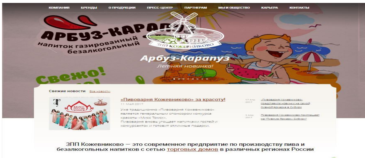
Рисунок 3 – сайт ЗПП «Кожевниково»