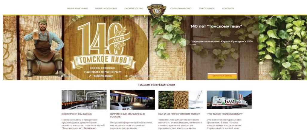
Рисунок 1 – сайт ОАО «Томское пиво»